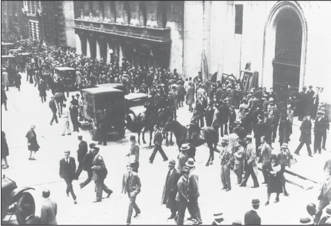
Nach dem Zusammenbruch der Aktienkurse an den New Yorker Börsen am 24. Oktober 1929 („Schwarzer Freitag“) löst die berittene Polizei aufgebrachte Menschenmassen an der Wall Street auf.

Prinzip den heutigen Finanzderivaten, und damals wie heute führten die Hebeleffekte nach dem Platzen der Blase zum sofortigen Ruin derjenigen, die damit spekuliert hatten. Am Ende hatten viele kleine Handwerker ihr gesamtes Vermögen verloren und saßen obendrein auf hohen Schulden, sodass sie nicht einmal in den alten Beruf zurückkehren konnten. Die Folgen für die Realwirtschaft waren entsprechend katastrophal.