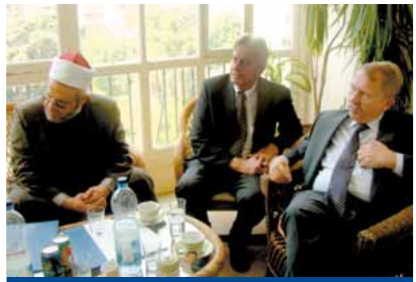
Helmut Rau (r.), Minister für Kultus, Jugend und Sport des Landes Baden-Württemberg, informiert sich im Büro der KAS Ägypten über die neue Veranstaltungsreihe "Politische Bildung für Imame"

die Konrad-Adenauer-Stiftung ist seit über dreißig Jahren mit einer Vielzahl von Projekten und Veranstaltungen in Ägypten aktiv. Dieses langjährige Engagement zeigt die zentrale Bedeutung, die Ägypten für die Stiftungsarbeit in den Ländern des arabischen Raumes einnimmt. Auch 2008 haben wir in enger Zusammenarbeit mit unseren ägyptischen Freunden und Partnern