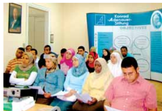
Ein Workshop im neuen Seminarraum der KAS Ägypten

Nicht zuletzt deshalb hat sich auch in unserem Büro einiges getan. Seit 2008 verfügt die KAS Ägypten nicht nur über zwei neue Arbeitsplätze für Praktikanten und eine vollständig überarbeitete und neu katalogisierte Bibliothek, sondern auch über einen eigenen Veranstaltungsraum für Seminare von bis zu 30 Personen. Ein paar Gründe mehr, dem Stiftungsbüro in Zamalek einen Besuch abzustatten. Wir freuen uns auf Sie.