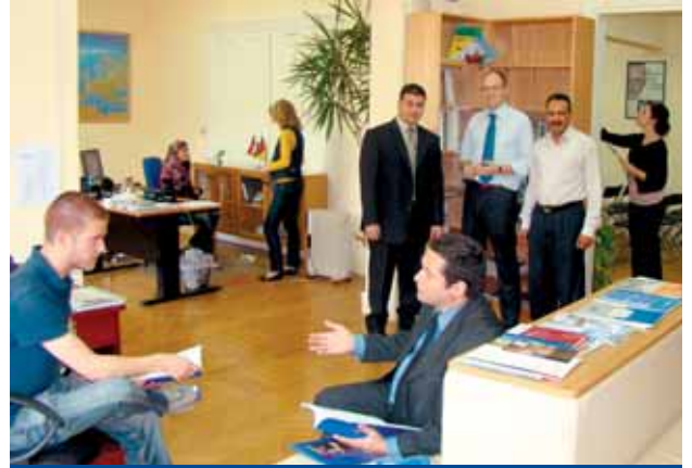
Das Team der KAS Ägypten in der neu eingerichteten Bibliothek des Büros

Das Programm der KAS Ägypten setzt 2009 auf eine Kombination von neuen Themen und bewährten Formaten. Als neues Schwerpunktthema soll vor allem die länderübergreifende Rechtsstaatsarbeit der Stiftung intensiviert werden. Geplant sind u.a. Schulungsmaßnahmen für Verwaltungsrechtler, eine Fachkonferenz über das Spannungsverhältnis zwischen säkularem und religiösem Recht in arabischen Ländern und verschiedene Bürgerforen zu Aspekten der Rechtsprechung. Thematisches Neuland will die Stiftung außerdem mit einer Reihe von Aktivitäten zum Thema „Krisenmanagement“ betreten. Daneben wird aber auch Bewährtes weitergeführt. Hierzu gehören vor allem unsere Think Tank-Arbeit mit dem IDSC, die Seminare zur Förderung von Frauenrechten, unsere Veranstaltungen zum Thema „Religion und Politik“, die verschiedenen Vorlesungs- und Seminarreihen an der Kairo Universität und unsere Sommerakademie für nachhaltige Entwicklung. Schließlich soll die erfolgreiche Workshopreihe „Politische Bildung für Imame“ 2009 fortgesetzt und um neue Module ergänzt werden. Insgesamt sind wir zuversichtlich, dass wir mit diesem Angebot von deutsch-ägyptischen Maßnahmen zur Förderung von Demokratie, sozialer Marktwirtschaft, Rechtsstaat und interreligiösem Verständnis auch 2009 auf Interesse in der ägyptischen Öffentlichkeit stoßen.