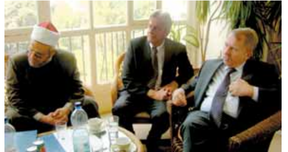
استقصر هيلموت راو (يمين)، وزير التعليم والشباب والرياضة لولاية بادن-فورتمبيرغ لجمهورية ألمانيا الاتحادية خلال زيارة له لمكتب المؤسسة بمصر عن سلسلة ورش العمل الجديدة للمؤسسة تحت عنوان "التثقيف السياسي لأئمة المساجد"

تعد مؤسسة كونراد أديناور منذ أكثر من ثلاثين عاماً ناشطة في عدة مجالات من خلال العديد من المشروعات والنشاطات في مصر، وهو ما يعكس مدي إيمان المؤسسة بالدور المحوري الذي تلعبه مصر في الوطن العربي، أما عن نشاط المؤسسة في عام ٢٠٠٨ فقد أقمنا ما يقرب من أربعين مؤتمراً مع شركاء وأصدقاء المؤسسة وهو ما مكننا من الوصول إلي الآلاف من المصريين والمصريات، هذا بالإضافة إلي العديد