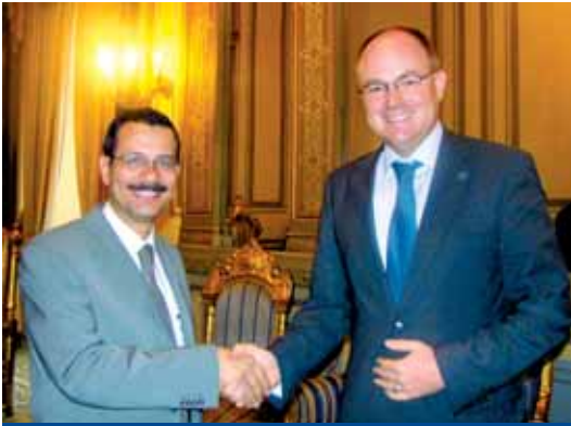
أكد آ. د. أحمد درويش (يسار)، وزير التنمية الإدارية خلال مشاركته لأحدى مؤتمرات المؤسسة على أهمية إستراتيجية مراكز الإستشارة السياسية

والإقتصاديين الألمان والمصريين، ونشعر بالفخر لإهتمام شخصيات مرموقة من داخل مصر وخارجها بنشاطاتنا، ولم تقف المؤسسة عند إستقبال الشخصيات الهامة فحسب بل سعدت أيضاً بإستضافة الكثير من العلماء الشبان والعديد من المهتمين بالسياسة من الجيل الجديد، ولم تغفل المؤسسة دور المتدربين الألمان قط، والذين يأتون إلي مصر ليتعرفوا عن قرب على عمل المؤسسة، فقد طورت المؤسسة من بنيتها التحتية وأضافت مكتبين إضافيين ليتسنى للمتدربين العمل جنباً إلي جنب مع فريق عمل المؤسسة، كما قمنا بإفتتاح قاعة مؤتمرات جديدة بالمكتب تستوعب ما يقرب من ٣٠ شخصاً.