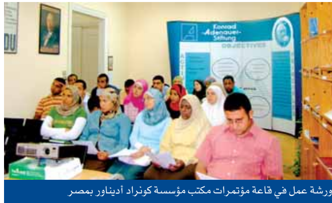
ورشة عمل في قاعة مؤتمرات مكتب مؤسسة كونراد أديناور بمصر

وأخيراً فقد إستطعنا إعادة رصد جميع كتب وإصدارات المؤسسة وإعداد قاعدة بيانات لها، وهو ما يجعلنا ندعوكم لزيارة مقر المؤسسة بالزمالك للإطلاع علي إصداراتها، فالمؤسسة تحاول دائماً فتح ذراعيها لطالبي العلم والمعرفة وخاصة الشباب منهم والشابات.