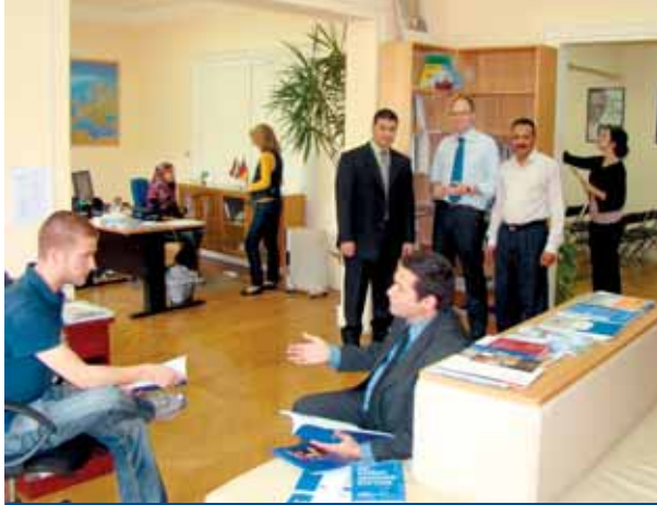
فريق عمل المؤسسة في مكتبة المؤسسة الجديدة

تضم نشاطات المؤسسة لعام ٢٠٠٩ العديد من الموضوعات المختلفة والجديدة فضلاً عن