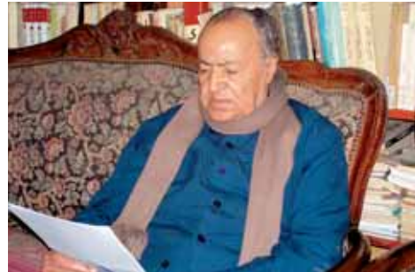
جمال البنا، المفكر الإسلامي خلال حديث خاص للمؤسسة لدراسة أصدرتها مؤسسة كونراد أديناور بمصر بعنوان "الدين والتعديل والتطوير - أصوات نقدية من مصر"

للتغيير وللإصلاح الديمقراطي؟ في هذا الإطار أقامت مؤسسة كونراد أديناور بالتعاون مع مؤسسة عالم واحد للتنمية ورعاية المجتمع المدني مؤتمراً ناقش عدة تجارب للتمثيل السياسي للتيارات الإسلامية في البرلمانات العربية، وقد حضر هذا المؤتمر لفييف من الأساتذة والخبراء والساسة ولم تكتفى المؤسسة بإقامة المؤتمرات فحسب، بل تقوم بإستمرار