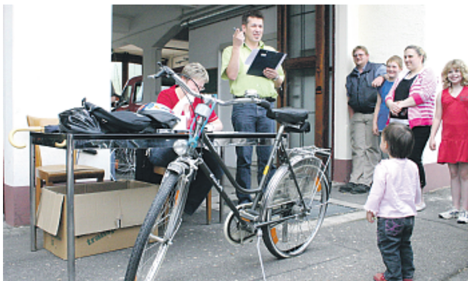
Bei der letzten Versteigerung des Bürgerbüros der Stadt Oberkirch kamen wieder zahlreiche Fundsachen zum Aufruf. Gerade die Fahrräder zogen das Interesse der Anwesenden auf sich. Über 400,00 Euro kamen durch die einzelnen Gebote bei der Auktion zusammen und fließen nun in den allgemeinen Haushalt der Großen Kreisstadt.

Weiter bietet die Gewerbe Akademie ab 8. Juni einen MS-PowerPoint-Grundkurs an. Unterrichtet wird Montag und Mittwoch, von 18 bis 21:15 Uhr. Die Teilnehmer lernen, wie und wo sie mit PowerPoint arbeiten können. Es werden Präsentationen manuell erstellt. Es geht um grundle-