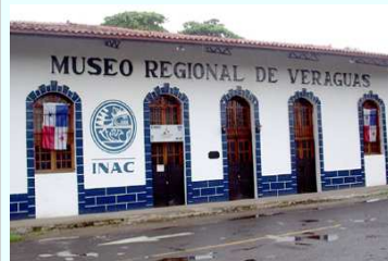
Museo Regional de Veraguas

Desde el año 2004 abrió sus puertas el Museo Regional de Veraguas. Uno de los lugares menos frecuentados en todo el distrito, a pesar de su gran valor histórico y cultural.