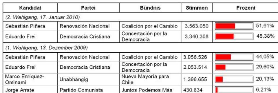
Tabelle 1: Ergebnis der Präsidentschaftswahlen (beide Wahlgänge)

Am 17. Januar 2010 hat der Unternehmer Sebastián Piñera Echenique wie erwartet die zweite Runde der Präsidentschaftswahl in Chile für sich entschieden. Es ist das erste Mal seit dem Ende der Pinochet-Diktatur und der Rückkehr zur Demokratie im Jahr 1989, dass ein Kandidat aus dem Lager der Mitte-Rechts-Parteien die Wahlen um das höchste politische Amt im Lande gewinnt. Der Kandidat des Oppositions-Bündnisses „Coalición por el Cambio“ erhielt 51,61 Prozent der Stimmen der registrierten Wähler, während der Anwärter des regierenden Mitte-Links-Bündnisses „Concertación de Partidos por la Democracia“, der Christdemokrat Eduardo Frei Ruiz-Tagle, auf 48,38 Prozent kam. Piñera hatte bereits den ersten Wahlgang am 13. Dezember 2009 mit deutlichem Vorsprung gewonnen, blieb damals jedoch unterhalb der magischen Marke von 50 Prozent der Stimmen, weshalb eine Stichwahl gegen Frei notwendig wurde. Piñera tritt somit am 11. März 2010 die Nachfolge der jetzigen Präsidentin Michelle Bachelet an. 1