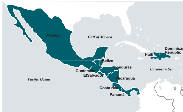
Gráfica No. 1 Países beneficiados por la Iniciativa Mérida