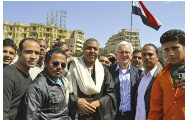
El eurodiputado Dr. Hans-Gert Pöttering junto con manifestantes en la plaza Tahir en El Cairo durante su viaje a Egipto en marzo de 2011.