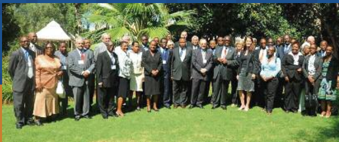
Participantes de la conferencia de derechos humanos de la KAS en Gaborone