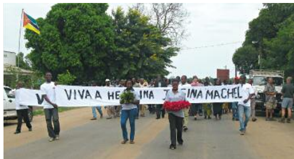
Participantes en el Día de Acción sobre el papel de la mujer en Mozambique.

Por ocasión del Día de la Mujer en Mozambique la Federación Mozambiqueña de Asociaciones Ciudadanas (GPAC) y la Konrad-Adenauer-Stiftung organizaron el 24 de abril en la provincia Gaza, un día de acción sobre el papel de la mujer. El Día de Acción incluyó discursos del administrador del distrito y de un testigo de su época que relató la vida de una feminista mozambiqueña. Más allá de eso las asociaciones de Guijá y Chokwe informaron sobre sus actividades de proyectos que incluyen tanto un compromiso social como medidas para generar ingresos.