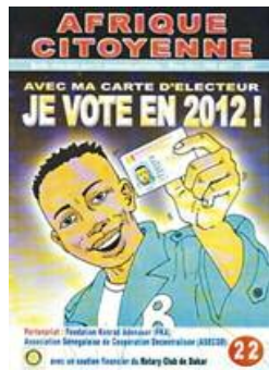
Publicación del Cómics: ¡Voy a votar en el 2012 con mi tarjetón electoral!

“Social Entrepreneurship” como clave para un desarrollo sustentable sobre todo en regiones rurales de África. En su discurso programático el Embajador de Sudáfrica en los EAU, Yacoob Abba Omar, señaló las crecientes inversiones extranjeras en África. Pasha Bakhtiar, fundador de WillowTree Investments, expuso el papel positivo que pueden desempeñar las inversiones privadas. Representantes del movimiento Rural Women’s Movement de KwaZulu-Natal (Sudáfrica) así como de “Dubai Cares” presentaron ejemplos de casos concretos exitosos.