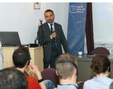
Pawel Osiej representación de la Comisión Europea en Polonia

Del 27 al 29 de mayo se realizó en Varsovia el juego de simulación "Cambiar el Clima de Europa" con un grupo de participantes de Polonia y Alemania en el marco de la academia política que está comprometida con organizaciones juveniles políticas. 40 participantes negociaron un incremento de la eficacia energética, de fuentes de