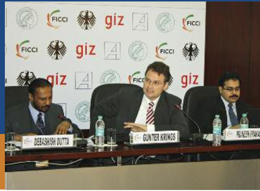
Prof. Dr. Günter Krings miembro del parlamento alemán durante el debate acerca del tema "Propiedad intelectual en la sociedad de información"