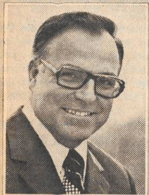
Helmut Kohl CDU

Die 19. Bundestagung des Evangelischen Arbeitskreises der CDU/CSU stand unter dem Motto „Zukunft und Hoffnung“. Helmut Kohl bezeichnete dieses Thema als die Herausforderung, die Zukunft nicht im Zeichen der Angst oder der Resignation, sondern im Zeichen der Hoffnung zu sehen — und zu meistern.