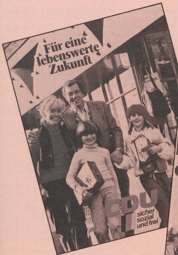
Die neue Illustrierte „Für eine lebenswerte Zukunft“

Besonders geeignet für Ihre Canvassing-Aktionen und zur Verteilung: