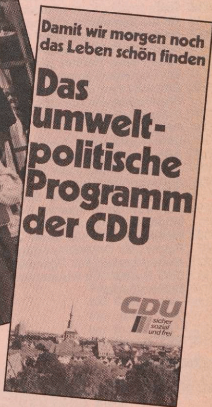
Die Kurzdokumentation zum umweltpolitischen Programm „Damit wir morgen noch das Leben schön finden“