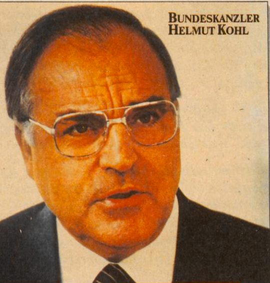
BUNDESKANZLER HELMUT KOHL