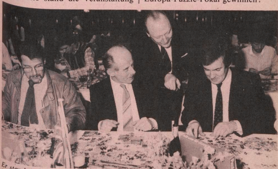
Er stand den Teilnehmern des CDU-Europa-Puzzeturniers mit Rat und Tat zur Seite: Kurt Malangré, Oberbürgermeister von Aachen und CDU-Kandidat für das Europäische Parlament

An die 100 Spieler, vom Schüler bis zum Staatssekretär, testeten ihre Geschicklichkeit im Aachener Quellenhof — welche der zehn Mannschaften würde am Ende den gestifteten Europa-Puzzle-Pokal gewinnen?