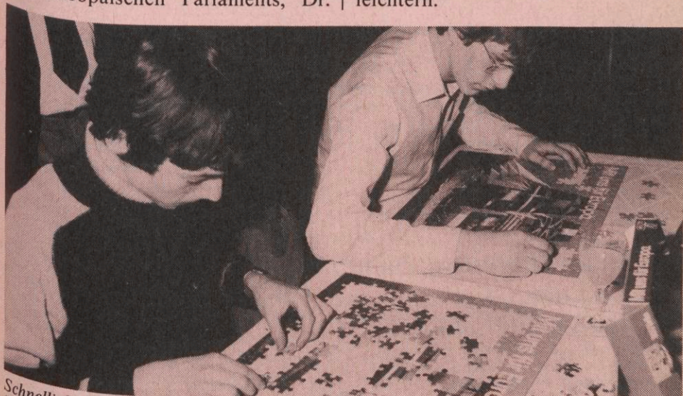
Schnelligkeit war Trumpf beim Europa-Puzzleturnier der CDU in Aachen. Der Sieger brauchte nur 23 Minuten, um aus den 300 Teilen das Europa-Schiff zusammenzulegen.

Mit Hilfe von Spenden konnten 372 Bücher zum Thema Europa angeschafft werden. Die Bibliothek soll vor allem Schülern und arbeitslosen Jugendlichen den Zugang zu dem komplizierten Gebilde Europa erleichtern.