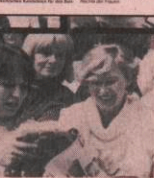
Die Gleichberechtigung der Frau im Alltag verwirklichen!

Die CDU ist eine Partei, die für die Gleichberechtigung der Frau im Alltag einsteht. Sie will, dass Frauen in Beruf, Familie und Gesellschaft die gleichen Chancen haben wie Männer. Das bedeutet, dass Frauen in allen Bereichen der Gesellschaft eine Stimme haben müssen. Die CDU setzt sich dafür ein, dass Frauen in allen Bereichen der Gesellschaft eine Stimme haben müssen.