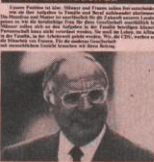
Immer mehr Frauen machen mit bei der CDU

Die CDU ist eine Partei, die für die Gleichberechtigung der Frau im Alltag einsteht. Sie will, dass Frauen in Beruf, Familie und Gesellschaft die gleichen Chancen haben wie Männer. Das bedeutet, dass Frauen in allen Bereichen der Gesellschaft eine Stimme haben müssen. Die CDU setzt sich dafür ein, dass Frauen in allen Bereichen der Gesellschaft eine Stimme haben müssen.