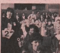
Die Gleichberechtigung der Frau im Alltag verwirklichen!