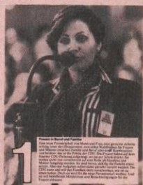
Die Gleichberechtigung der Frau im Alltag verwirklichen!

Die CDU will, dass Frauen in allen Bereichen der Gesellschaft eine Stimme haben müssen. Sie will, dass Frauen in allen Bereichen der Gesellschaft eine Stimme haben müssen. Die CDU setzt sich dafür ein, dass Frauen in allen Bereichen der Gesellschaft eine Stimme haben müssen.