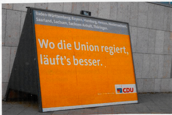
... „Wo die Union regiert läuft 's besser!“

Der Bundesausschuss fasste außerdem einen Beschluss zur Bildungspolitik, in dem sich die CDU gegen eine Einheitsschule nach rot-grünem Muster wendet.