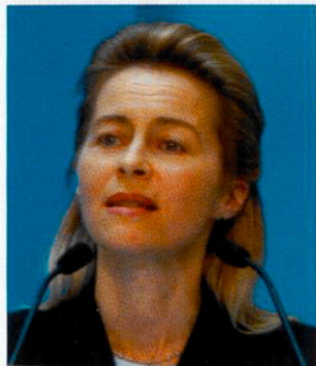
r für die Mens

Die Partei- und Fraktionsvorsitzende rief die CDU dazu auf, sich noch stärker als bislang um Zukunftsaufgaben zu kümmern. Deutschland dürfe sich beim Pro-Kopf-Einkommen nicht – wie die jüngste OECD-Studie gezeigt habe – mit dem 18. Platz vor Griechenland, Polen und Tschechien zufrieden geben. Auch müsse die CDU alle rot-grünen Versuche abwehren, mit einer „süßen Sauce der Verklärung“ über den wahren Zustand des Landes hin-