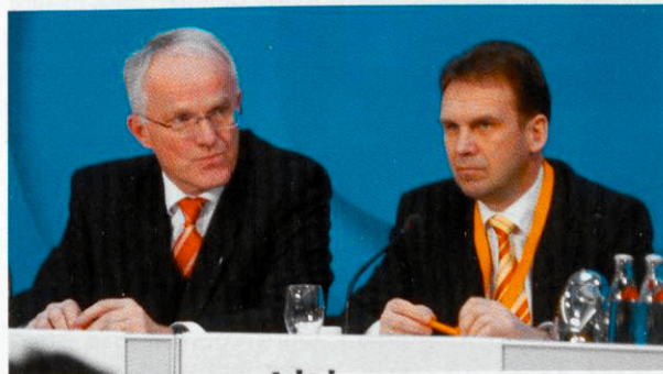
NRW-Chef Jürgen Rüttgers mit Thüringens Ministerpräsident Dieter Althaus

Als „nicht zu überbietende Frechheit“ bezeichnete Merkel den Umgang von Rot-Grün mit dem Europäischen Stabilitäts- und Wachstumspakt. Die Regierung kehre damit einer jahrzehntelangen Stabilitätspolitik den Rücken. So werde mit wachsenden Schulden die Substanz von morgen „verbraten“. Besonders dramatisch stelle sich die Situa-