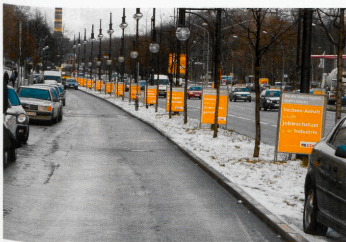
Eine Plakataktion vor der CDU-Bundesgeschäftsstelle zeigte eindrucksvoll: ...

milienkasse nach dem Vorbild Frankreichs und nannte als Schwerpunkte der Unionskommission zur Familienpolitik drei Säulen: Finanzielle Gerechtigkeit für Familien, bessere Vereinbarkeit von Familie und Beruf sowie die Stärkung der Erziehungskompetenz. Insgesamt müsse in Deutschland ein familienfreundlicheres Klima und eine familienfreundlichere Arbeitswelt geschaffen werden, forderte Böhmer. Niedersachsens Sozialministerin Ursula von der Leyen schloss sich ihrer Vordnerin an: „Kinder brauchen Eltern, die zufrieden sind mit ihrer Lebensperspektive“. Anstatt hier richtige Rahmenbedingungen zu setzen, sei ein schlechtes Gewissen in die Familien hin-