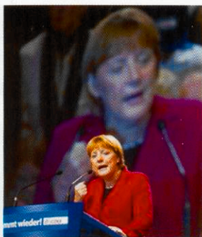
Angela Merkel ruft zum Kampf um jede Stimme auf

Dafür müsse aber bis zum Wahltag gekämpft werden. Jeder Bürger müsse spüren, dass es der CDU um die Menschen und deren Sorge vor Verlust ihrer Jobs gehe, sagte Merkel weiter. Sie ver-