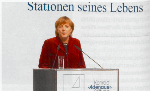
Die CDU-Vorsitzende, Angela Merkel, erinnerte an die Verdienste Bundeskanzler Helmut Kohls für die deutsche und europäische Einigung.

Klar wandte sich Angela Merkel gegen jegliche Versuche, die Deutsche Einheit