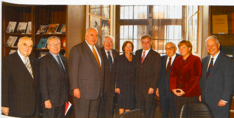
v.l.: Lord Georg Weidenfeld, Jacques Delors, Helmut Kohl, Bernhard Vogel, Eva Herzigová, Ernst Albrecht, Henry Kissinger, Angela Merkel und

Bankautomaten in Berlin gezogen hätten, auch in Paris bezahlen könnten. „Aus Ihrer Vision sind inzwischen 25 Sterne geworden“, sagte Mißfelder und spielte damit auf die jüngste Erweiterung der Europäischen Union an. „Herr Kohl, Sie haben dafür gesorgt, dass die Schlagbäume an den Grenzen verschwunden sind.“ Nun sei es an der jungen Generation dafür zu sorgen, dass auch „die Schlagbäume in den Köpfen“ verschwänden, so Mißfelder.