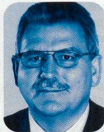
W. Langen MdEP

sich mit ihren Kollegen aus Ankara im Vorfeld der angekündigten Aufnahmen von Beitrittsverhandlungen im Oktober. Die negativen Volksentscheide in Frankreich und in den Niederlanden hatten die Gespräche schon im Vorfeld überschattet, wobei sich die türkische Seite standhaft weigerte, einen Zusammenhang zwischen den Abstimmungsergebnissen der Referenden und dem Beginn der Beitrittsverhandlungen zu sehen.