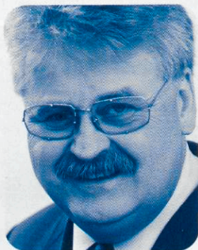
Elmar Brok MdEP

Die wenigsten der Gründe hatten etwas mit der Verfassung zu tun. Im Gegenteil: Die Verfassung erst soll ja die Politik auf EU-Ebene deutlich besser und bürgernäher machen. Sie soll gerade die kritisierten Punkte angehen: Ohne den Verfassungsvertrag gäbe es keine Stärkung der Bürgerrechte, keine rechtlich bindende Wertebindung durch die Charta der Grundrechte, keine Stärkung der demokratischen Legitimation und der Subsidiarität – auch durch die Stärkung der nationalen Parlamente –, keine Transparenz z.B. durch Öffentlichkeit des Rates bei Gesetzgebungsentscheidungen, keine ausreichende Effizienz für die EU der 25, keine Stärkung unserer Rolle in der Welt sowie keine Bindung an Preisstabilität und die Soziale Marktwirtschaft.