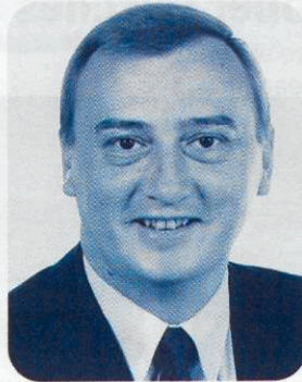
Ingo Schmitt MdEP

Regierungen momentan die politische Kraft zur Umschichtung ihrer Etats fehlt, werden die Bürger und Unternehmen zur Kasse gebeten. Ein solches Vorhaben käme einem staatlich verordneten Spendenauftrag gleich.