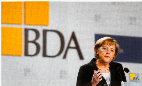
Bundeskanzlerin Angela Merkel

Auch das Ziel, die Lohnzusatzkosten auf unter 40