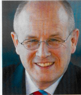
Volker Kauder, Vorsitzender der CDU/CSU-Bundestagsfraktion

Der Arbeitskreis Steuerschätzung hat uns eine gute Nachricht verkündet: Die Steuereinnahmen von Bund, Ländern und Gemeinden fal-