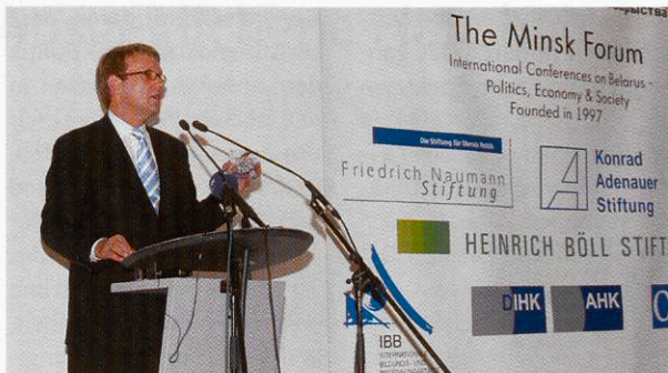
Generalsekretär Ronald Pofalla eröffnet das Minsker Forum

Nach seiner Rückkehr rief Generalsekretär Pofalla alle Medien, die Kirchen und die Vertreter der gesellschaftlichen Gruppen in Deutschland auf, der Menschenrechtssituation in Weißrussland, einem Staat in unmittelbarer Nachbarschaft zur EU, mehr Aufmerksamkeit zu schenken. Als Beispiel für die erschreckende Situation nannte Ronald Pofalla fünf