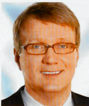
CDU-Generalsekretär Ronald Pofalla

Diese Entwicklung erfüllt uns mit Sorge. Schließlich ist die Türkei ein Freund Deutschlands und ein verlässlicher Partner in der NATO. Wir wollen die europäische Orientierung der Türkei nachdrück-