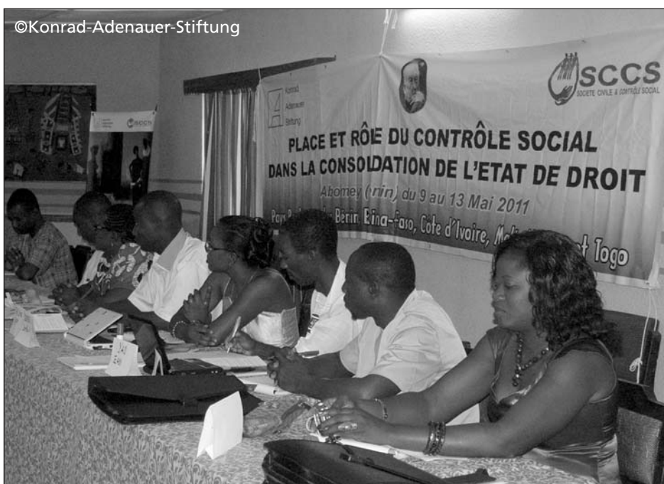
Schulung Zivilgesellschaft regional

Durch ihre langjährige Tätigkeit pflegen die politischen Stiftungen in vielen Ländern über Jahrzehnte gewachsene enge Verbindungen zu ihren Partnern und können sich so auf ein solides Netzwerk politischer und gesellschaftlicher Kräfte stützen. Das dadurch