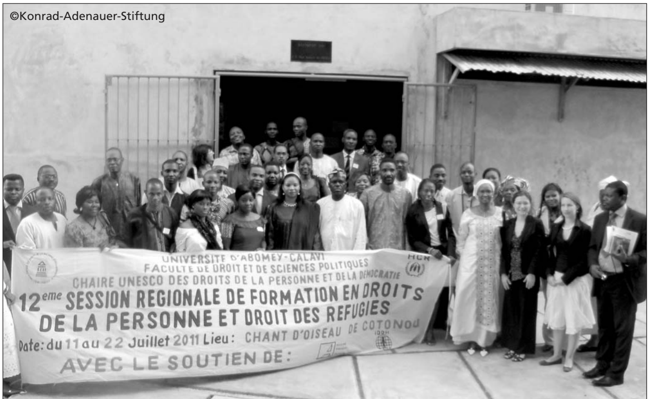
Der UNESCO-Lehrstuhl für Demokratie und Menschenrechte veranstaltete im Juli 2011 eine Regionalkonferenz zum Thema Menschen- und Flüchtlingsrechte in Cotonou

ben zu organisieren und programmatisch aufzustellen sowie Personal für politische Führungsaufgaben eines Staates bereitzustellen. Alles dies geschieht in einem ständigen Wettbewerb der verschiedenen politischen Anbieter. Afrikanische