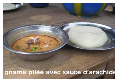
igname pilée avec sauce d'arachide

Ne ratez pas les bananes frits (Aloko) ainsi que les ananas et les mangues frais qu'on achète pour quelques monnaies au bord de la rue ou au marché.