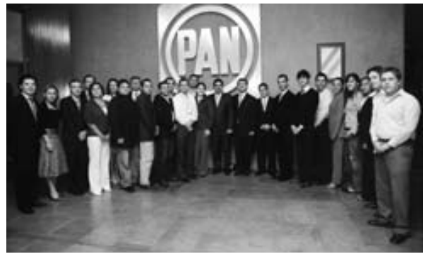
Förderung des politischen Führungsnachwuchses der ODCA-Parteien ist ein Arbeitsschwerpunkt der KAS. Unser Bild zeigt Kursteilnehmer aus ganz Lateinamerika im Hauptquartier des mexikanischen „Partido Acción Nacional“ gemeinsam mit dem Partei- und ODCA-Vorsitzenden, Manuel Espino Barrientos (Mitte).

Die in diesen sechs Punkten genannten Arbeitsschwerpunkte ermöglichen der Konrad-Adenauer-Stiftung eine Positionierung innerhalb ihrer Kernkompetenz als politische Stiftung. Gerade das zugrunde liegende Partnerverständnis und der „ideologische“ Gleichklang mit Parteien der gleichen „Familie“ ermöglichen ein besonderes Vertrauensverhältnis, das in Beratungsoffenheit mündet und es nicht beim bloßen Zugang eines x-beliebigen Sponsors belässt. Dies ist eine deutliche Stärke im Vergleich zu Mehrparteien-Förderungsansätzen, deren Sinn damit keineswegs in Abrede gestellt werden soll. Die deutsche Eigenheit einer pluralistischen Parteienförderung aber rechtfertigt sich gerade in solchen Kooperationen. Auch wenn es vielerorts chic geworden ist, eher auf Kooperationen mit der sogenannten Zivilgesellschaft zu setzen und diese zu stärken (was immer „Zivilgesellschaft“ dann im Einzelnen heißt): Parteien sind der zentrale Baustein einer lebendigen, liberalen und pluralistischen Demokratie, die durch nichts zu ersetzen sind. Will man die Demokratie stärken, führt an einer Stärkung ihrer zentralen Träger kein Weg vorbei.