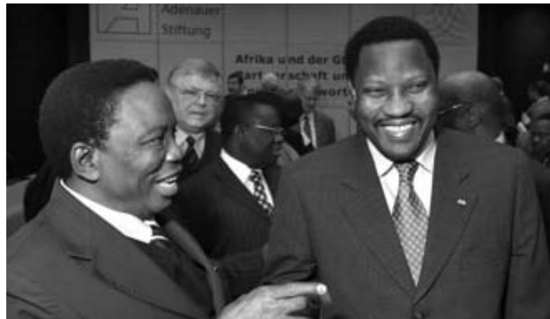
Die Ministerpräsidenten von Niger, Hama Amadou (re.), und Togo, Yawovi Agbovibo, auf dem WD-Treffen in der Akademie der KAS.

Parteienförderung ist ein zentrales Mandat einer politischen Stiftung wie der KAS. Die politischen Stiftungen waren vor 40 Jahren Pioniere in diesem Bereich. Die KAS hat – auch in Afrika – über viele Jahre hinweg wichtige Erfahrungen gesammelt. Wir bilden in vielen Ländern gerade junge Politiker aus und weiter und entwickeln Handbücher zu den Grundlagen von Parlamentsarbeit und Parteaufbau. Allerdings ist Parteiförderung in Afrika kein einfaches Geschäft. Dies liegt an strukturellen Problemen, mangelnden Ressourcen und z. T. an den Akteuren selbst. Da sich die KAS die Förderung von politischen Parteien in Afrika zur zentralen Aufgabe macht, ist die noch intensivere Förderung des Netzwerkes dieser Parteien, also UPADD und WD, notwendig. Das beharrliche Engagement der EVP-ED-Fraktion und einzelner MdEP sowie der beteiligten Stiftungen sind dafür gute Voraussetzungen.