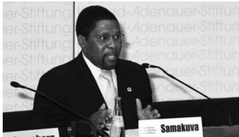
UPADD-Präsident Isaias Samakuva aus Angola auf der Pressekonferenz zur NEPAD-Resolution in der Akademie der Konrad-Adenauer-Stiftung, Mai 2007.

Das zweite Treffen des WD fand im September 1996 in Brüssel, das dritte im Juli 1997 in Luxemburg statt, was verdeutlicht, dass es sich um eine Euro-Afrika-Initiative handelt. Beim vierten und entscheidenden WD haben sich 1998 in Windhoek Vertreter von 19 Parteien aus 18 afrikanischen Ländern auf gemeinsame Prinzipien verständigt, eine Satzung verabschiedet und die Union of African Parties for Democracy and Development (UAPDD) gegründet, wobei sich als Abkürzung mittlerweile die französische Abkürzung UPADD ( Union des Partis Africains pour la Démocratie et le Développement ) herauskristallisiert hat.