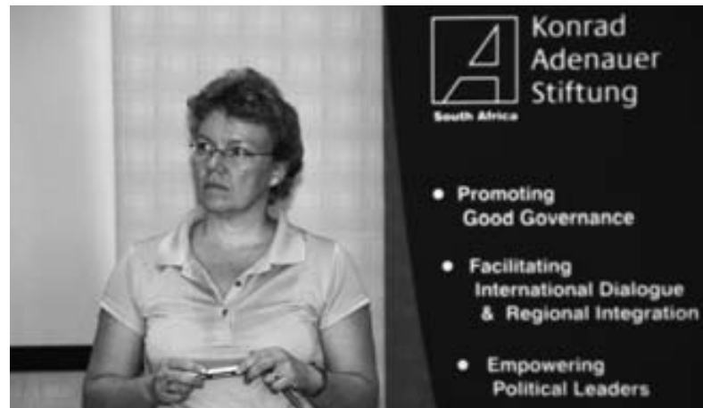
KAS-Seminar in Südafrika

In nahezu allen der 70 Auslandsbüros der KAS werden Aktivitäten durchgeführt, die eine Stärkung demokratischer Parteistrukturen und -verfahren sowie die Herausbildung demokratischer Parteiensysteme zum Inhalt haben. Den Zielsetzungen der internationalen Arbeit der KAS entsprechend liegt der Schwerpunkt der Aktivitäten in Ländern, die in der jüngeren Vergangenheit einen Übergang von nichtdemokratischer Herrschaft zur Demokratie erlebten (post-kommunistisches Mittelost- und Südosteuropa, z. T. Afrika) sowie in Ländern, in denen die Demokratie noch nicht vollständig als Herrschaftsform entwickelt ist (Teile Asiens und Afrikas). Aufgrund der seit Jahrzehnten bestehenden Kontakte zu Parteien in Lateinamerika spielt Parteienkooperation dort aufgrund der langjährig gewachsenen gemeinsamen Traditionen und geteilter Werte neben entwicklungspolitischen Gesichtspunkten auch aus außenpolitischer Sicht eine besondere Rolle, wengleich die Maßnahmen im Bereich der Parteienförderung auch organisatorische und programmatische Beratungsleistungen einschließen. Darüber hinaus pflegt die KAS einen strategischen Dialog mit einer Vielzahl von Parteien weltweit.