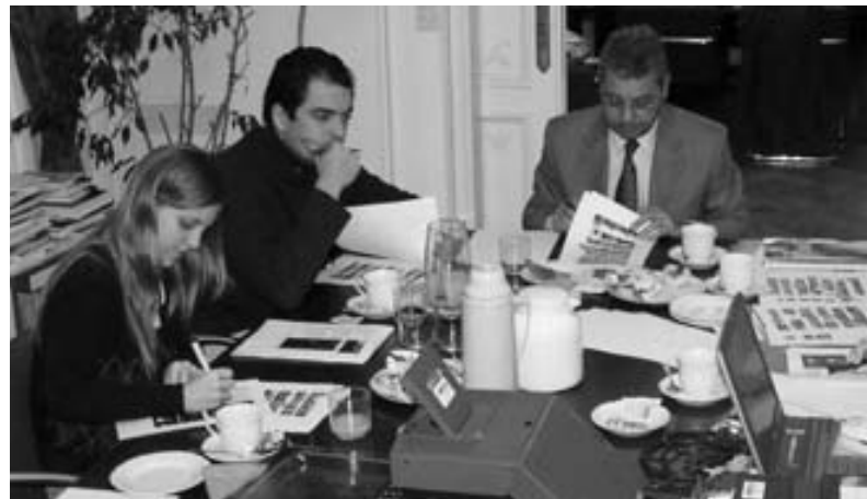
Workshop zur politischen Kommunikation im KAS-Büro in Buenos-Aires.

waltung bekleiden. Parteien nehmen daher eine wichtige Brückenfunktion zwischen der Zivilgesellschaft und den Institutionen eines demokratischen Staates wahr.