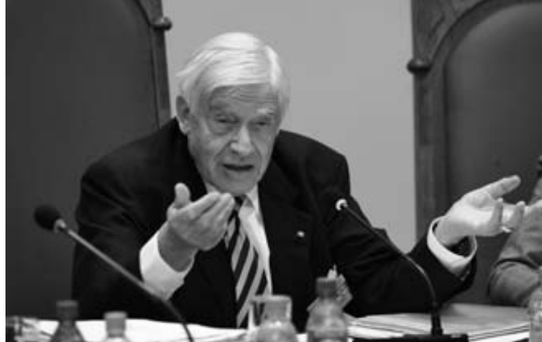
Der Hohe Repräsentant und Sonderbeauftragte der EU für BuH, Dr. Christian Schwarz-Schilling, auf der von der KAS organisierten Tagung zur Verfassungsreform am 22. Mai 2007 in Sarajevo.

In Bosnien und Herzegowina entwickelt sich damit seit dem Ende der kommunistischen Herrschaft ein Mehrparteiensystem auf der Grundlage der Konflikte zwischen den drei im Lande lebenden Völkern/Nationen. Angehörige von Minderheiten haben nach dem im Einklang mit der Verfassung stehenden Wahlsystem keine Möglichkeit, für bestimmte Ämter gewählt zu werden (Präsidentschaftsmitglieder, Entitätspräsidenten, zweite Kammer des gesamtstaatlichen Parlamentes). Koalitionsabsprachen stehen im Zeichen der Bildung ethnischer Blöcke. Andererseits ist die Aufteilung zwi-