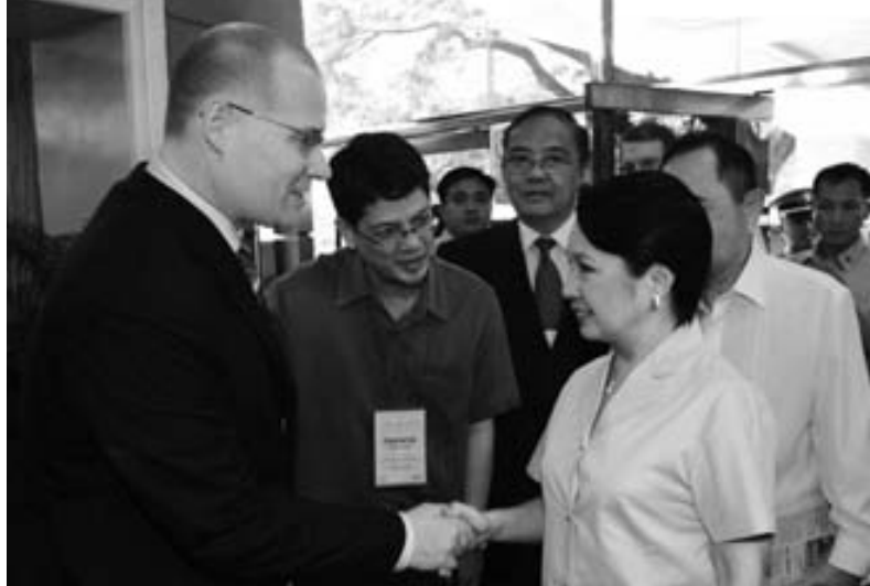
Präsidentin Gloria Macapagal Arroyo nimmt zusammen mit christlich-demokratischen Politikern an einem Seminar der KAS teil.

Trotz dieser anhaltenden Wahlerfolge ist die Partei organisatorisch und programmatisch schwach. Dies gilt auch für alle anderen Parteien, die sich in der Regel an einer Person festmachen und sich mehrheitlich zu einer den Präsidenten unterstützenden Koalition zusammenschließen. Die Nähe zur Zentralmacht im Lande bringt vor allem Vorteile in Bezug auf Infrastruktur- und Entwicklungsprojekte in den Provinzen. Nach wie vor ist es üblich, dass Abgeordnete und Kommunalpolitiker, die im Wahlkampf für eine unterlegene Partei kandidiert haben, nach den Wahlen in das Lager des Siegers übertreten. Eine grundsätzliche Auseinandersetzung zwischen Regierung und Opposition findet daher nur sehr eingeschränkt statt.