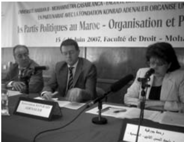
Kolloquium der KAS zum Stand der politischen Parteien in Marokko.

Vordergrund. Zur Erreichung dieser Ziele dienen auch die Rechtsstaats-, Medien- und politischen Dialogprogramme der KAS. Parteienförderung ist von den anderen Programmen also niemals isoliert zu betrachten. Nur dort, wo die politischen Rahmenbedingungen soweit gereift sind, dass überhaupt demokratische Parteien existieren, können sie gezielt gefördert werden.