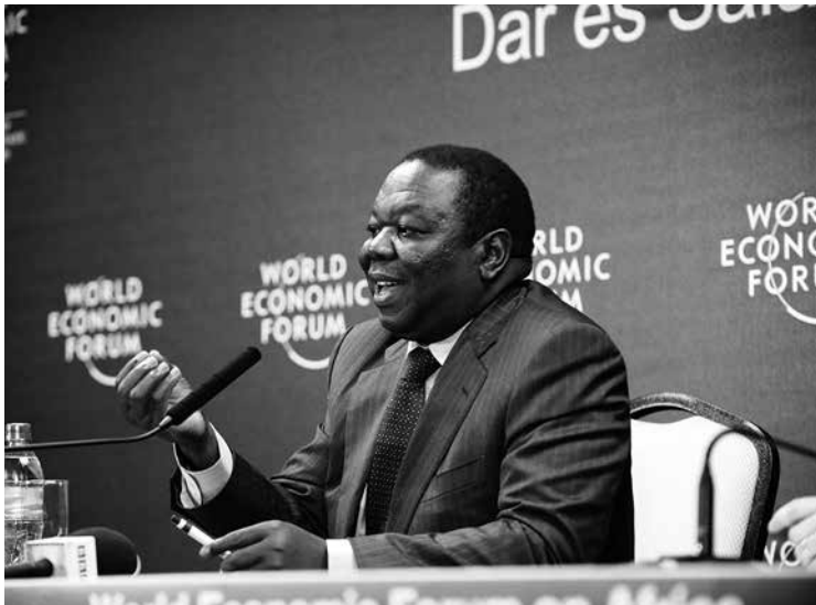
Morgan Tsvangirai (Foto) war schon bei den Präsidentschaftswahlen 2008 gegen Mugabe angetreten.

an der künftigen Verfassung neu ausgerichtet werden. In Abhängigkeit von der Anzahl der Gesetze, auf die sich der Verfassungsentwurf auswirkt, kann dies einige Zeit in Anspruch nehmen. Zudem müssen Schlüsselinstitutionen, die im Verfassungsentwurf bestimmt sind, eingerichtet werden. Das betrifft insbesondere eine unabhängige Exekutivkommission und weitere Institutionen wie die Nationale Strafverfolgungsbehörde. Schließlich sieht der Verfassungsentwurf auch eine Veränderung des Wahlsystems einschließlich einer Neudefinition der Wahlkreise vor. 27