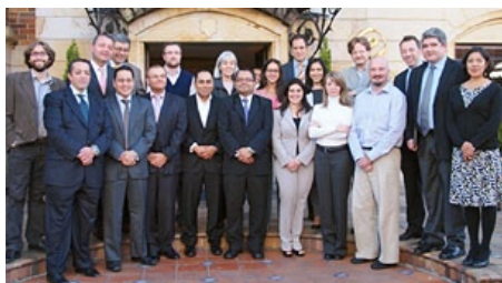
El grupo latinoamericano de estudios de derecho penal internacional el 3 de octubre de 2012 en Bogotá