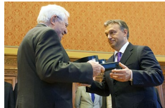
El presidente Dr. Viktor Orbán entrega al Prof. Dr. Bernhard Vogel la Gran Cruz del Mérito de la República de Hungría.

En reconocimiento a sus extraordinarios esfuerzos para integrar a Hungría a la Unión Europea, el Prof. Vogel recibió también la Gran Cruz al Mérito en el marco de una solemne ceremonia. La condecoración, que le fue concedida por el presidente húngaro, le fue entregada al Prof. Vogel por el primer ministro húngaro, el Dr. Viktor Orbán. La Gran Cruz al Mérito es la condecoración más elevada para los ciudadanos extranjeros. En la ceremonia, realizada en el Parlamento húngaro, participaron destacadas personalidades de la política, la ciencia y la sociedad.