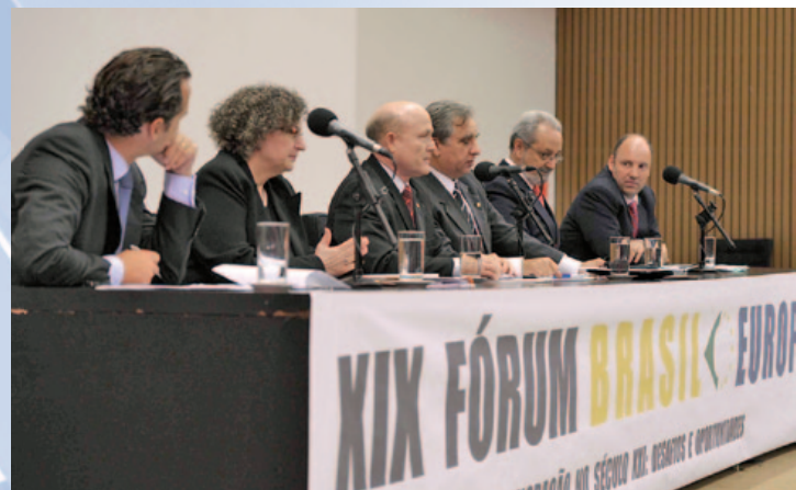
Panel inaugural del XIX Foro Brasil-Europa en el Congreso Nacional.

También se discutió acerca de las consecuencias que el cambio climático tiene sobre la migración y el trato con quienes huyen de zonas en crisis, así como sobre la trata de personas, que rebasa las fronteras.