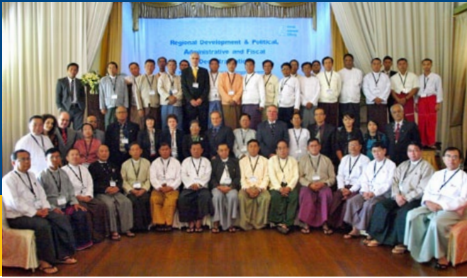
Participantes en la conferencia internacional en Rangún, Myanmar.