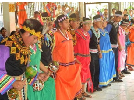
Los invitados fueron honrados con danzas y rituales tradicionales.

má, para intercambiar sus experiencias y discutir sobre posibles soluciones en interés de todos los grupos de la población. Una conversación con las autoridades tradicionales de Ngäbe-Buglés ofreció una mirada más profunda a la vida en la autonomía.