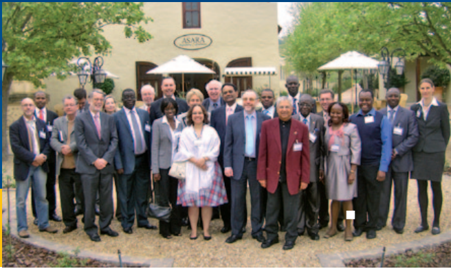
Los participantes de las dos conferencias en Stellenbosch provenían de África, América del Sur y Asia.