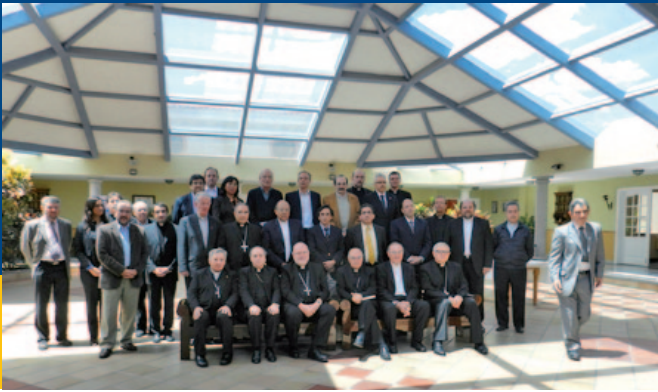
El Cardenal Reinhard Marx (fila inferior, tercero desde la izquierda) en el círculo de los participantes en la Conferencia de la KAS y el CELAM realizada en Quito.