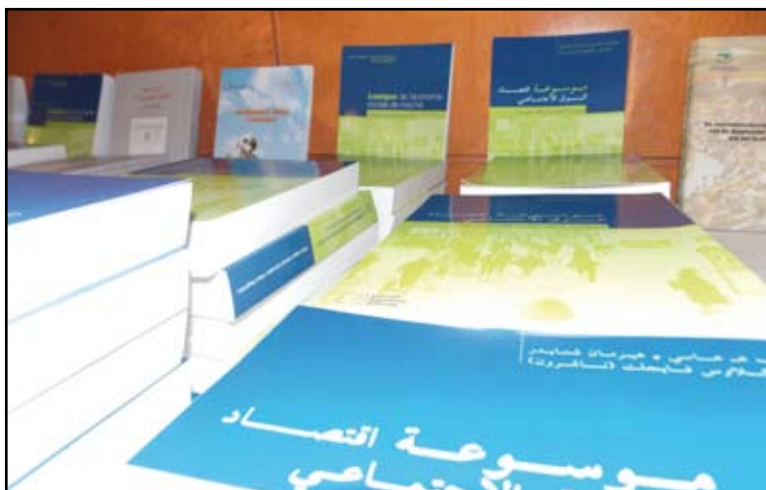
Version arabe du lexique de l'économie sociale du marché.

Le pire qui puisse arriver à une nation c'est de perdre son désir d'inventer son propre avenir, c'est pire que de perdre la volonté de le construire. La corruption est l'ennemi de la performance et de la société du mérite. Dans cette perspective, le raisonnement et les principes de l'économie sociale de marché constituent, sans doute, un modèle approprié pour le monde arabe.