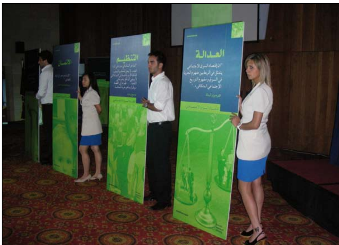
Présentation des panneaux de la campagne du lancement de la version arabe du lexique de l'économie sociale de marché à Amman, Jordanie.

Principe 10 : Les entreprises sont invitées à agir contre la corruption sous toutes ses formes, y compris l'extorsion de fonds et les pots-de-vin.