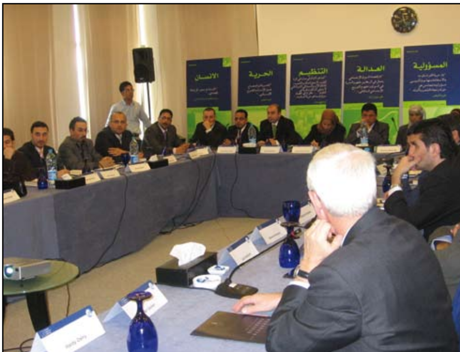
Au cours de l'atelier intitulé "Economie sociale de marché dans le monde arabe" tenu à Amman, la KAS présente l'économie sociale de marché à ses partenaires.

Dans ce contexte, il faut également mentionner que la mise en œuvre des mesures citées n'est pas facile. Elle diffère considérablement d'une branche à l'autre, voir à l'intérieur d'une même branche entre les différentes entreprises, en fonction des conventions collectives applicables. Les taux de croissance relativement faibles et le taux de chômage en hausse, ont affaibli, au cours des dix dernières années, la position des partenaires sociaux, notamment des syndicats. Le patronat est moins disposé à faire des concessions au niveau des salaires et les syndicats ne peuvent plus faire accepter leurs revendications salariales. Pour cette raison, le nombre de travailleurs syndiqués a été réduit de presque la moitié au cours des quinze dernières années (1991-2006). La mondialisation et l'intégration de la main-d'œuvre de l'Europe de l'Est et d'outre-mer ainsi que la délocalisation des entreprises à l'étranger ont également contribué à affaiblir la position des syndicats. Et pourtant, selon un rapport publié par l'« Institut der Deutschen Wirtschaft – IWD », leur importance en tant que partenaire social et contre-pouvoir face à la puissance du patronat et du capital n'est pas contestée en Allemagne.