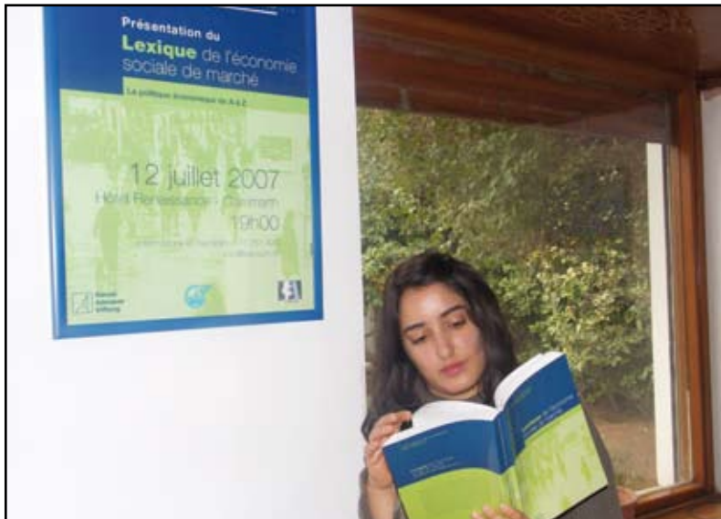
Version française du lexique de l'économie sociale du marché

marché », elle est basée sur la conviction profonde qu'il faut intégrer « les exigences sociales d'une société moderne dans un système de libre concurrence » (A. Müller-Armack).