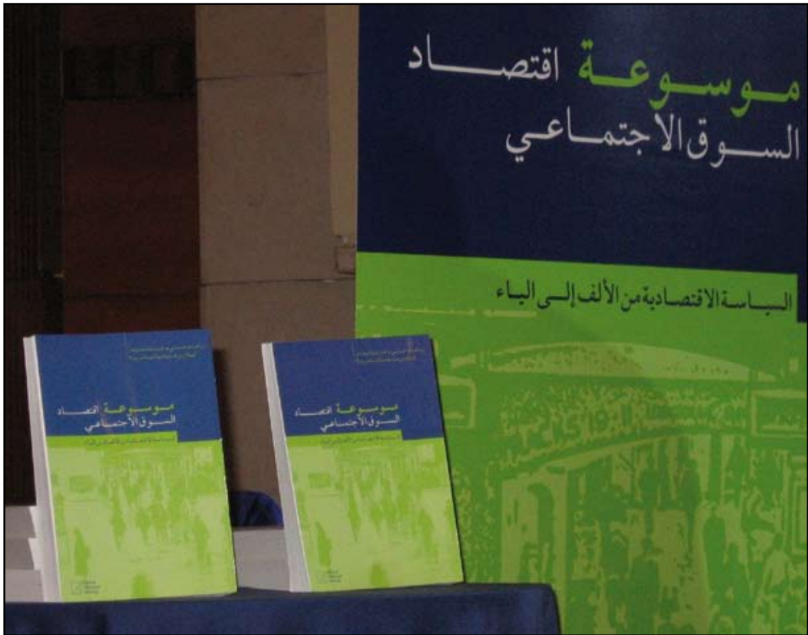
Lancement de la version arabe du « Lexique de l'économie sociale de marché » à Amman, Jordanie.