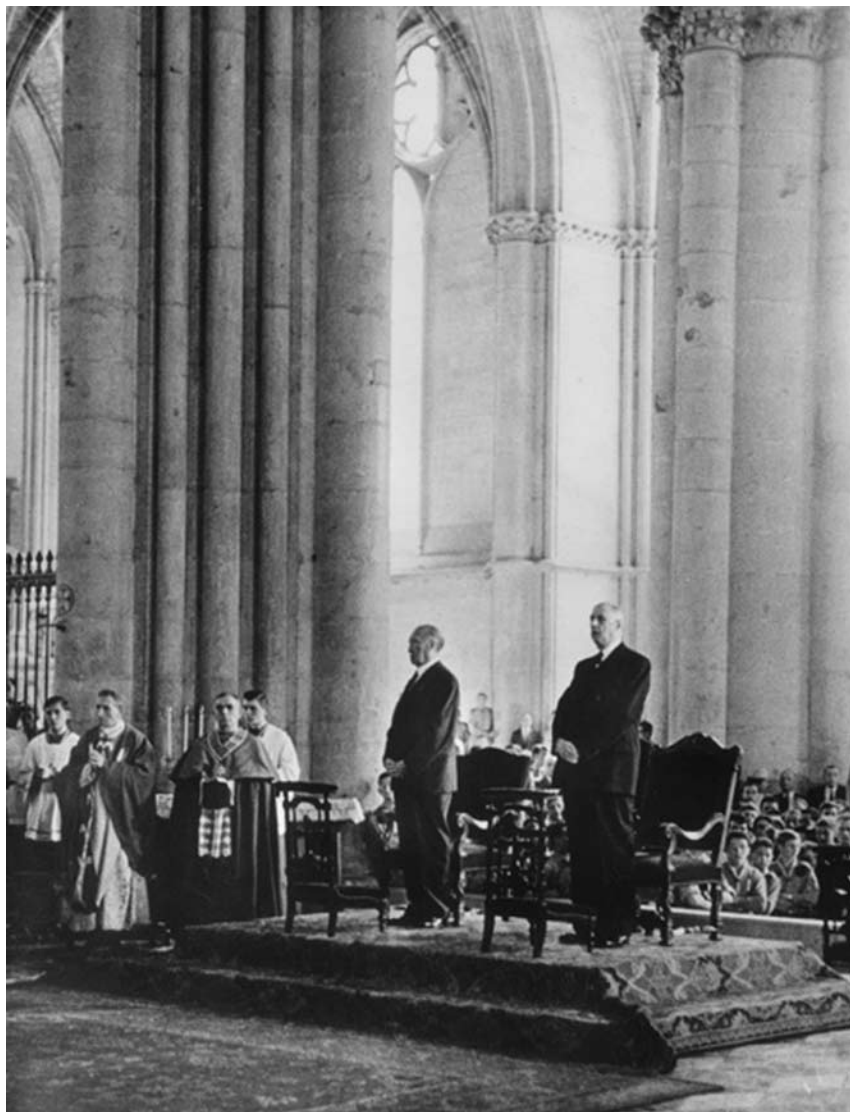
U katedrali Reims sa Šarl de Golom, prilikom posete Francuskoj, 8. jul 1962. godine