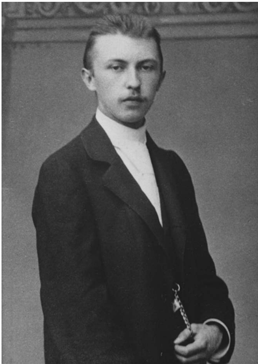
Kao student u Bonu, 1896. godine