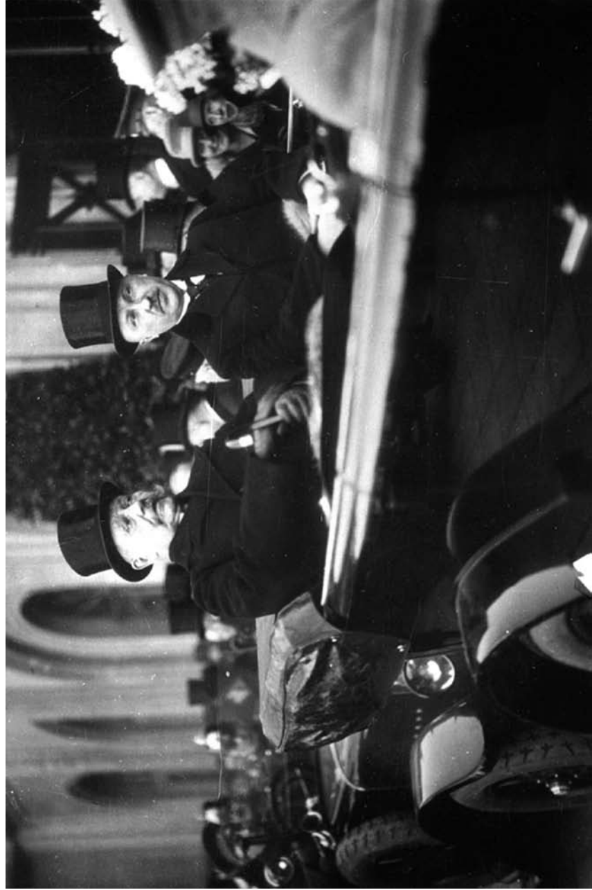
Kao gradonačelnik Kelna sa predsednikom Nemačke, Paul von Hindenburgom, prilikom ceremonije povodom povlačenja okupacionih trupa iz Rajnlanda, 1926. godine