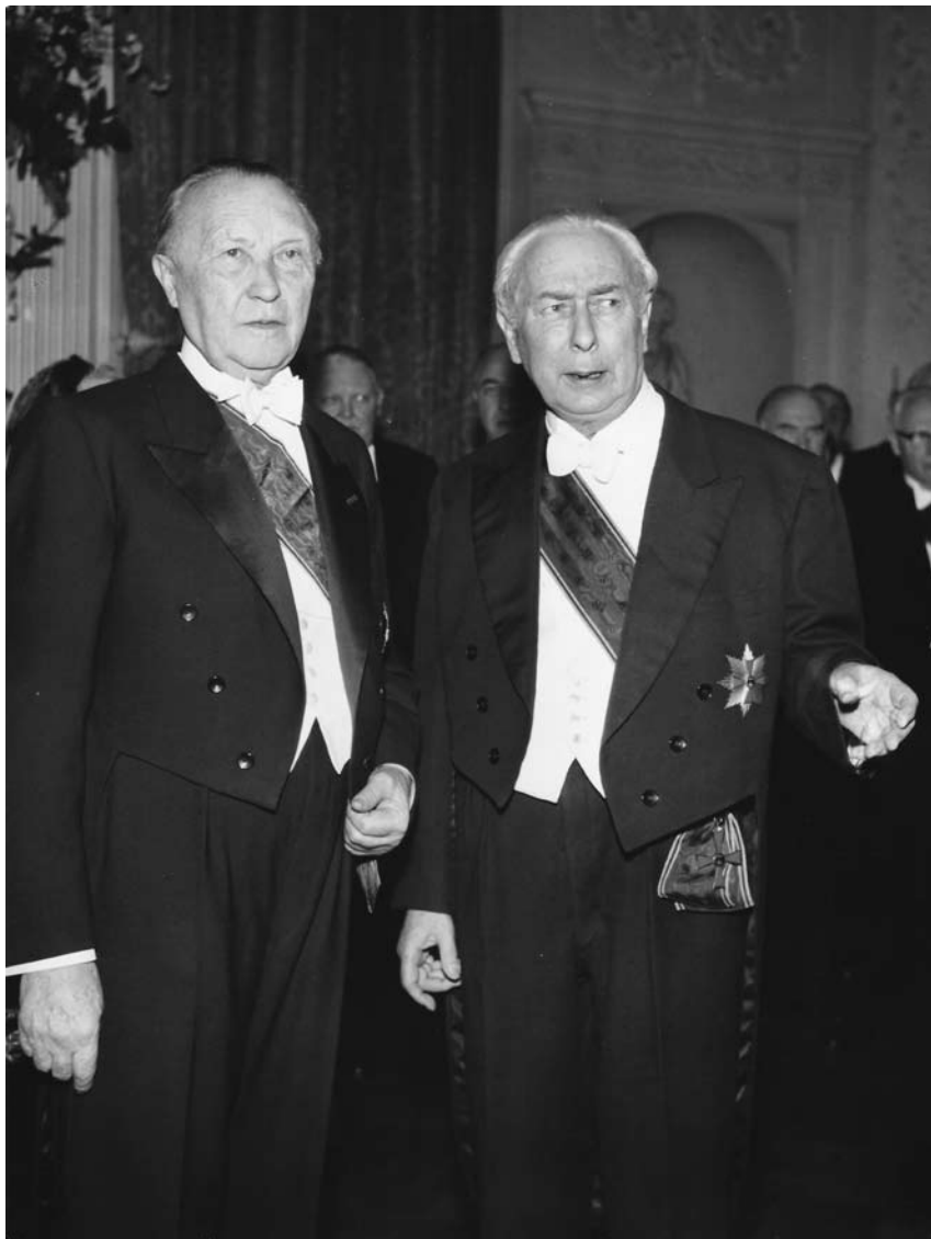
Sa predsednikom Savezne Republike Nemačke Teodorom Hojseom