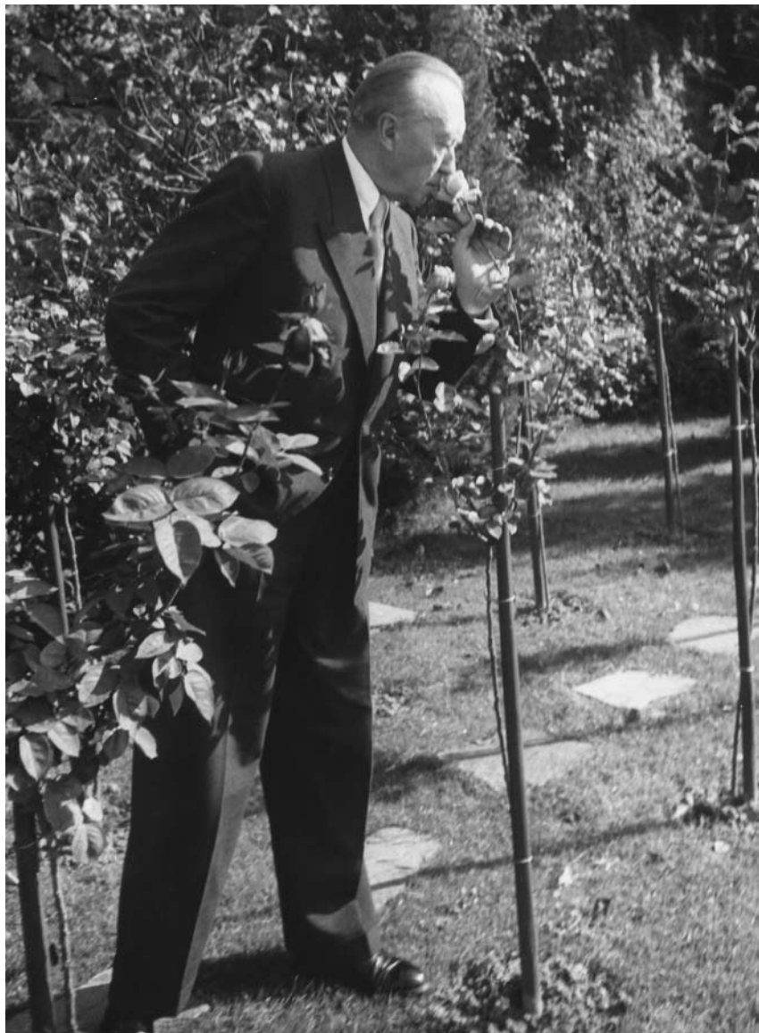
U dvorištu porodične kuće u Rondorfu