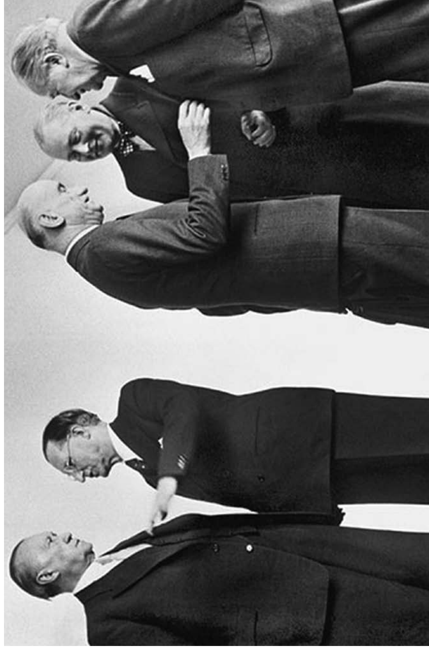
Sa Alisdair de Gasperijem, Robertom Šumanom i ministrima spoljnih poslova Holandije i Luksmeburga prilikom sastanka Saveta Evrope u Strazburgu 1951. godine