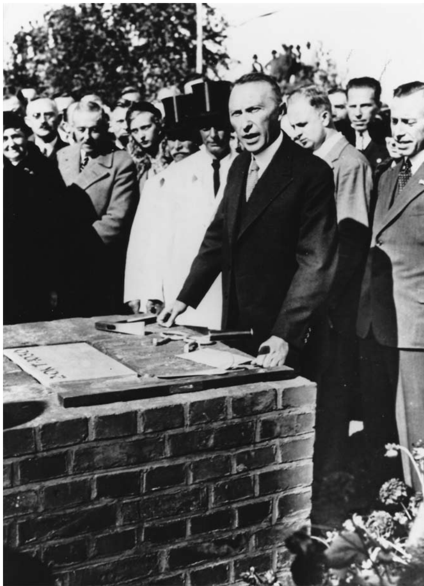
Kao gradonačelnik Kelna, prilikom početka izgradnje fabrike automobila „Ford“, 1930. godine