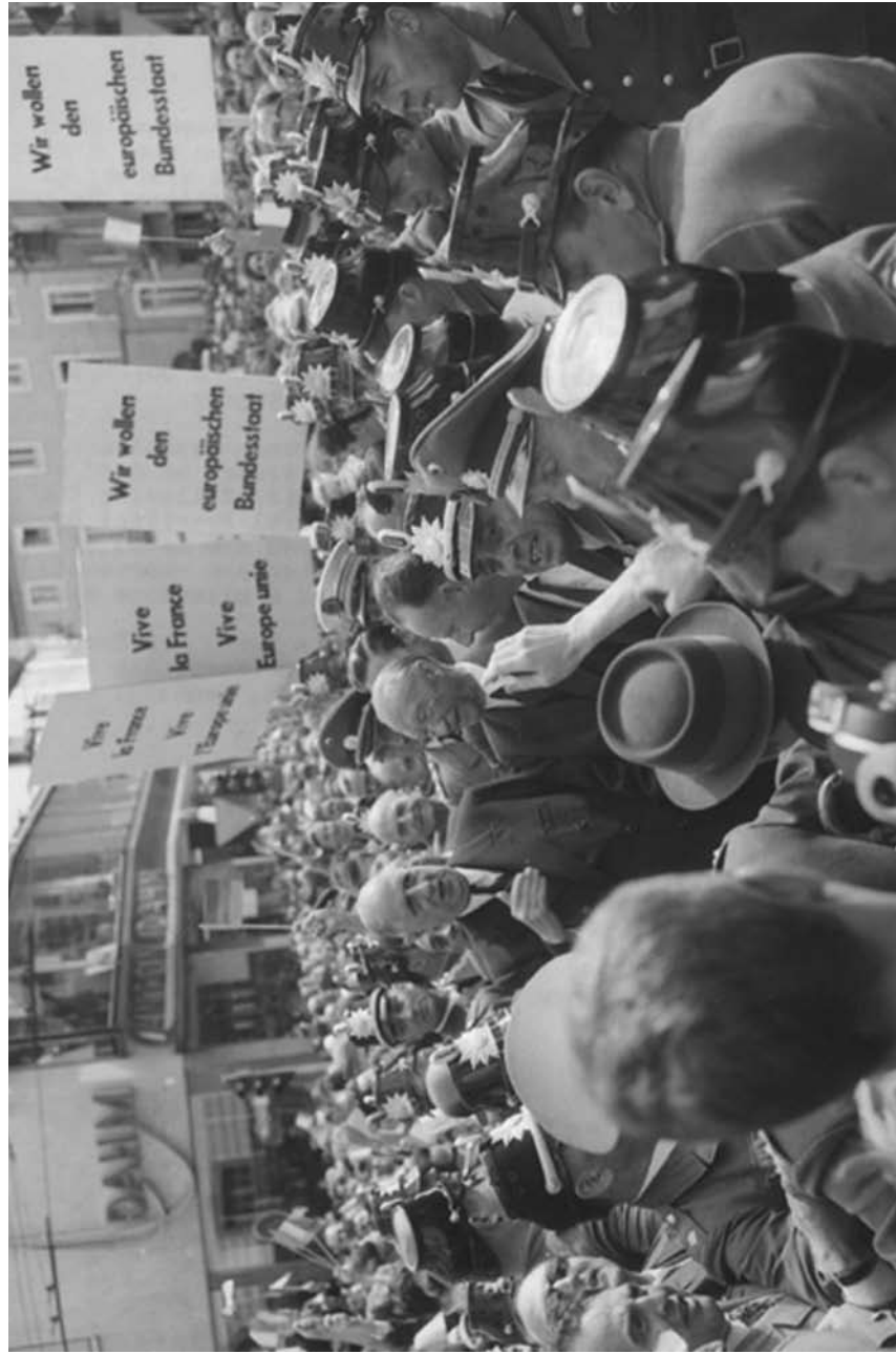
De Gol u poseti Nemačkoj, Bon, 19. septembar 1962. godine