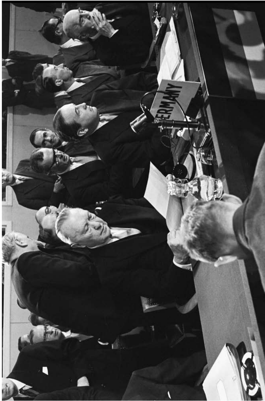
Savezna Republika Nemačka postaje članica NATO, 6. maj 1955. godine