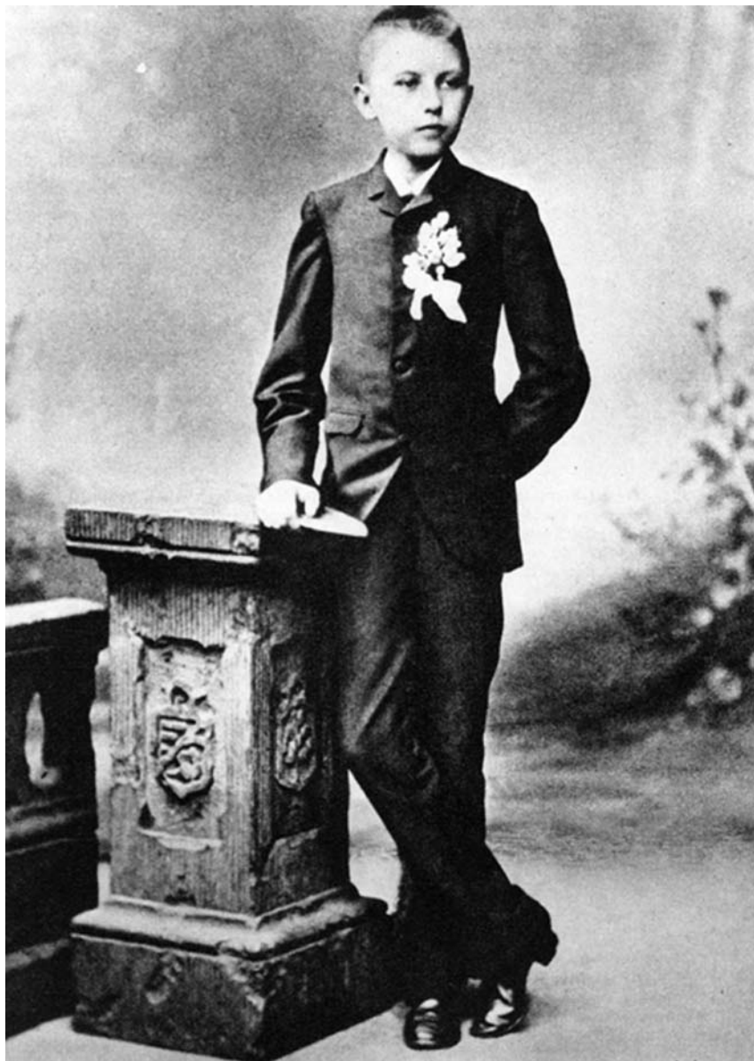
Konrad Adenauer 1887. godine