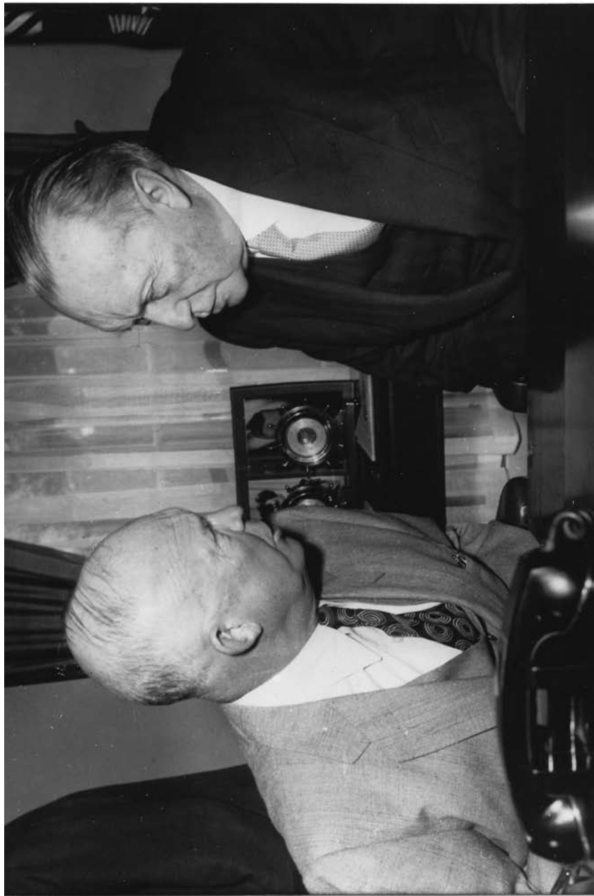
Razgovor sa Dvajtom D. Aizenhauerom prilikom posete SAD-u, 17. oktobar 1954. godine