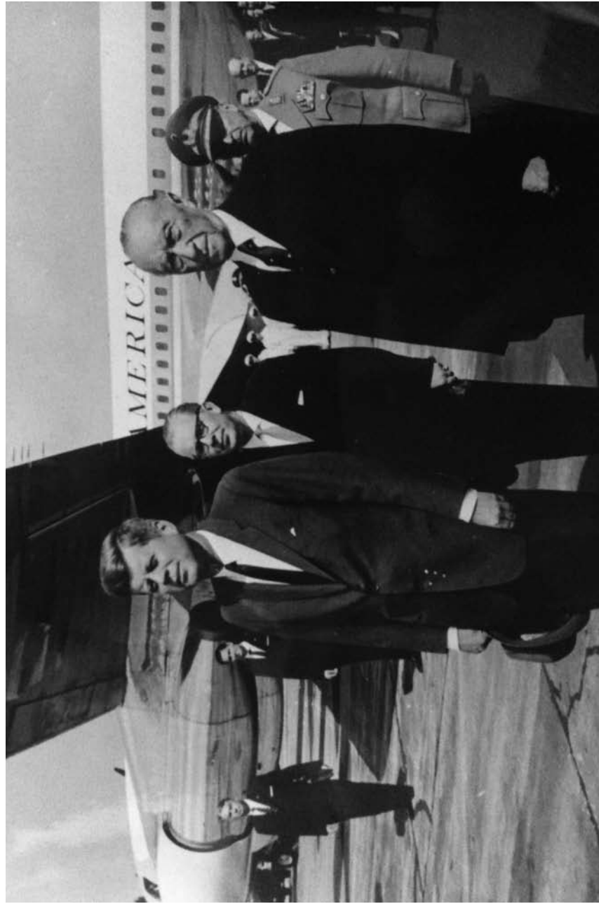
Doček predsednik SAD Džona F. Kenedija prilikom njegove posete Nemačkoj, Keln, 23. jun 1963. godine