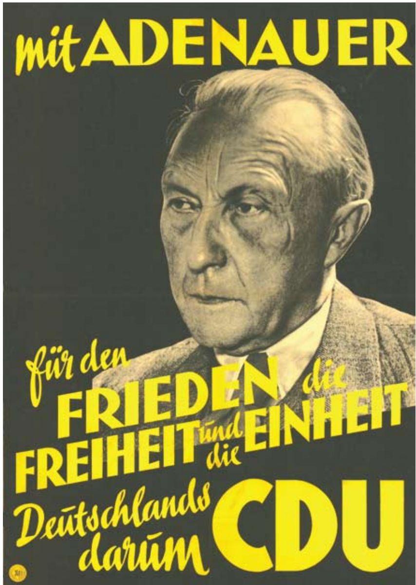
9. 10. Izborni plakat iz 1949. godine: „Za mir, slobodu i jedinstvenu Nemačku. Zato CDU“