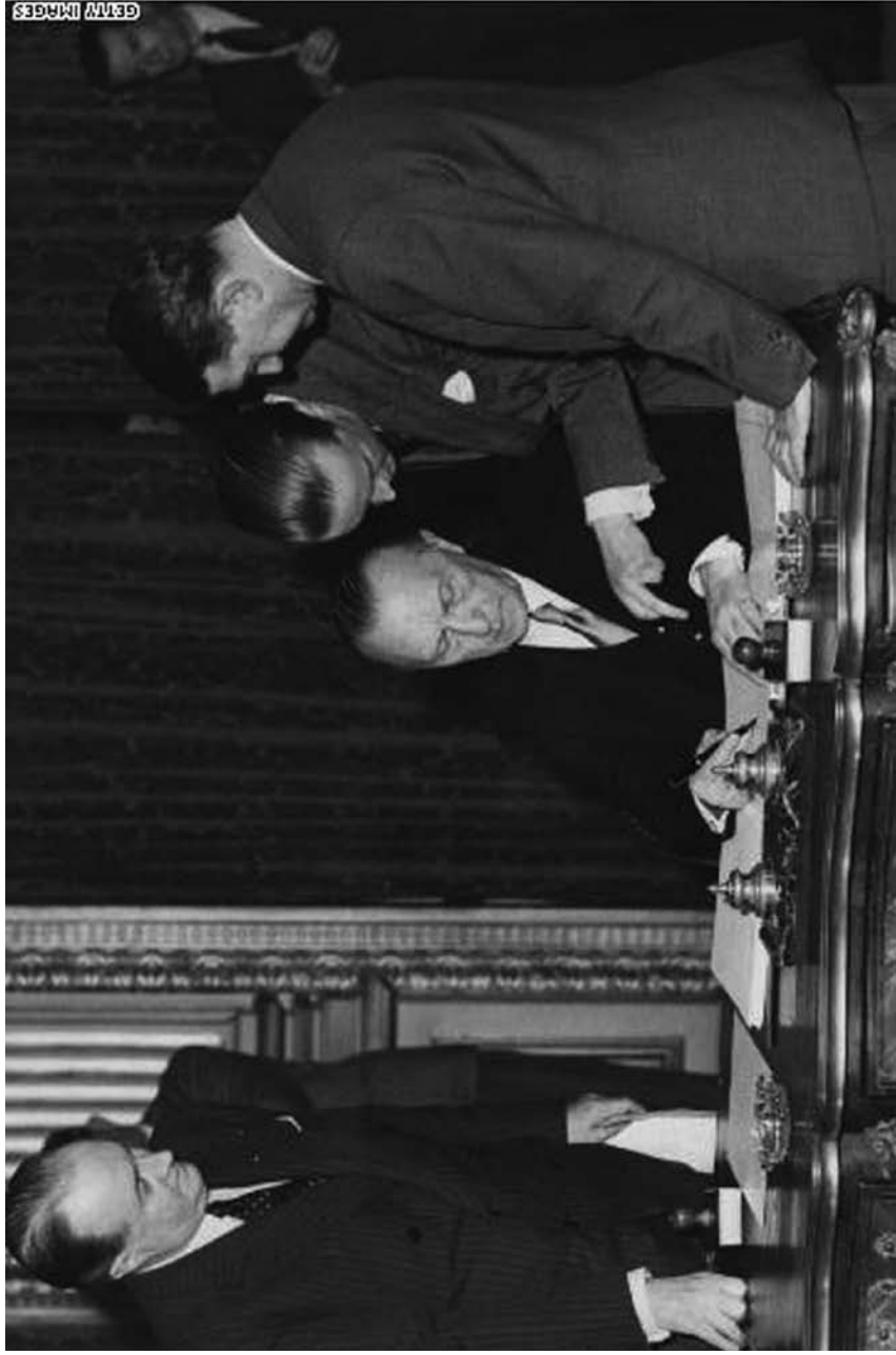
Konrad Adenauer potpisuje Ugovor o osnivanju Evropske zajednice za uglj i čelik u Parizu, 18. april 1951. godine