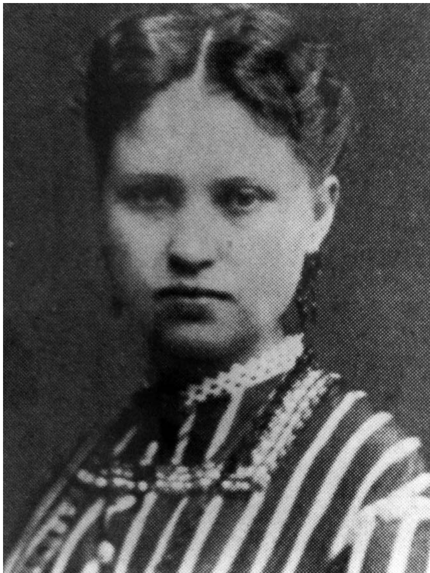
Helena Maria Kristiane Adenauer, rođena Šarfenberg, majka Konrada Adenauera