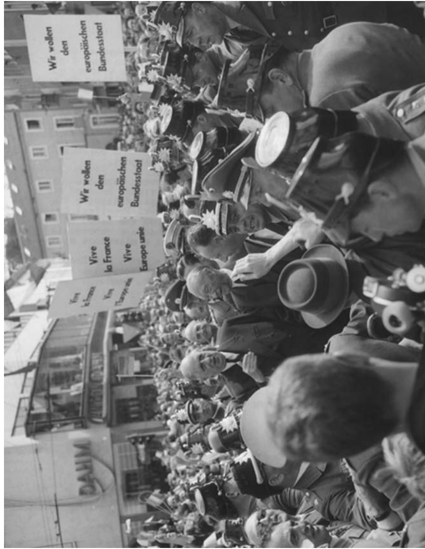
Sustret sa izraelskim premijerom Davidom Benom-Gurionom u Njujorku, 14. mart 1960. godine