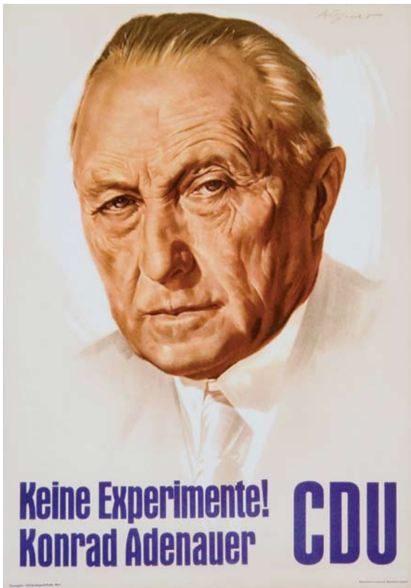
Jedan od najupečatljivijih plakata za izbore 1957. godine