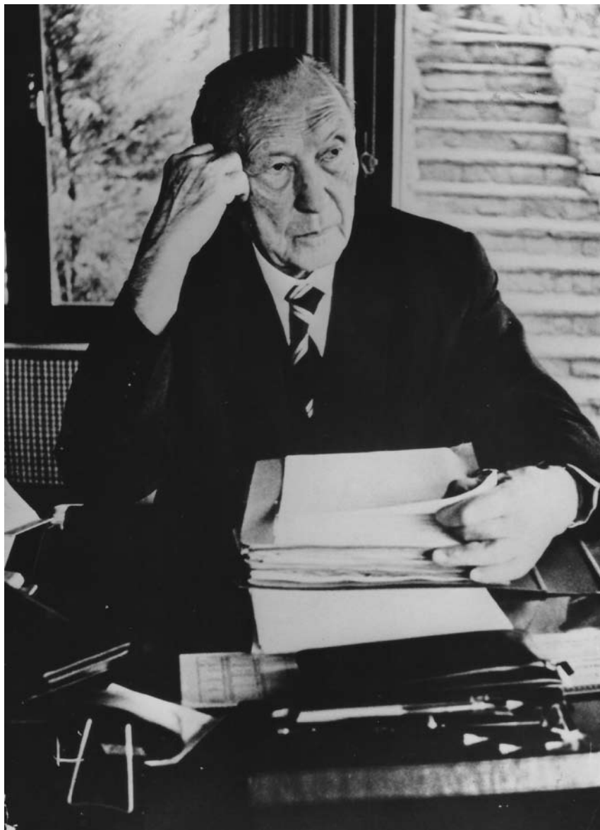
Prilikom pisanja njegovih Memoara , 1964. godine