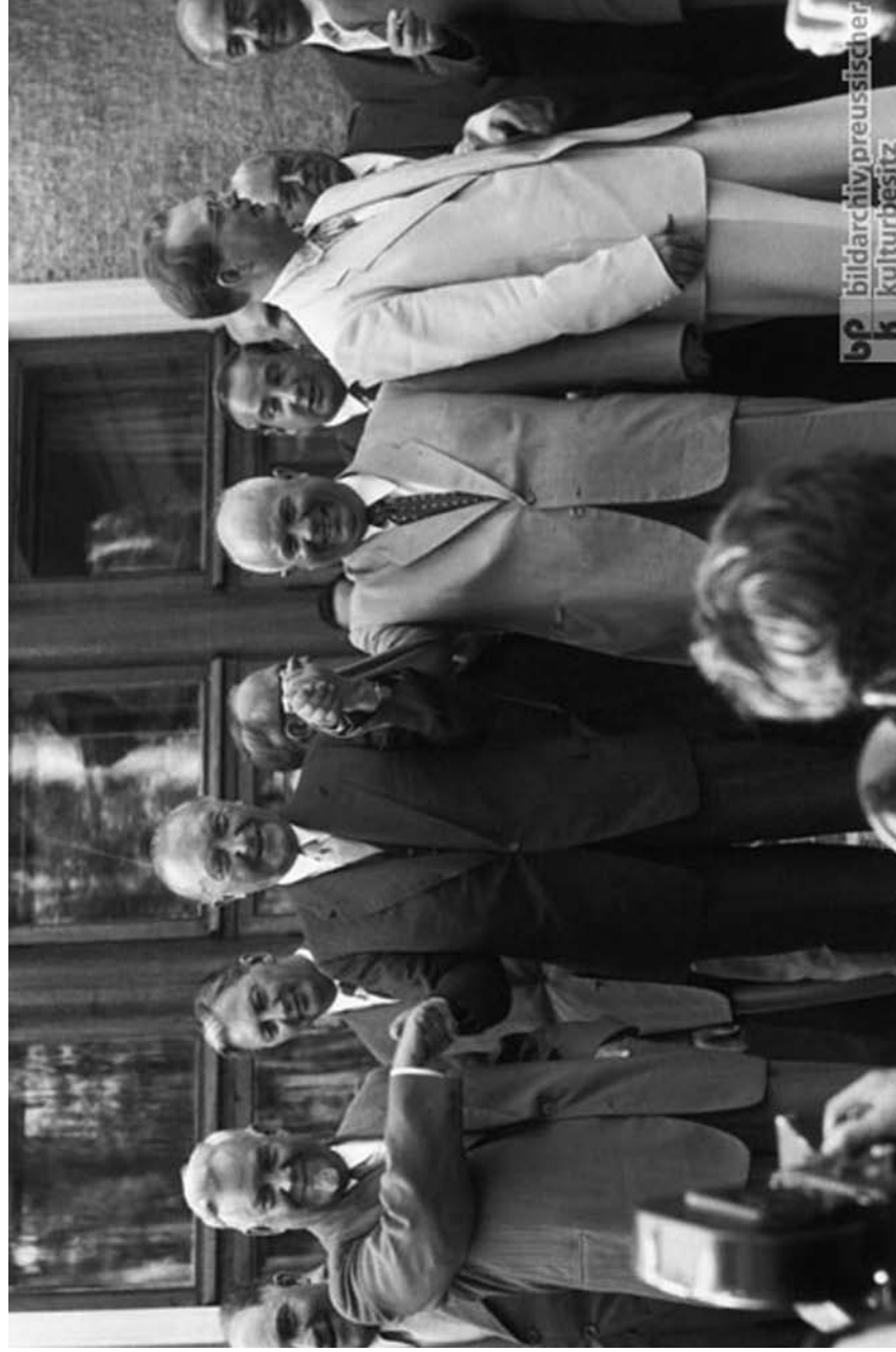
U poseti Moskvi. Levo od Adenauera je Nikolai Bulganjin, a desno Nikita Hruščov, 11. septembar 1955. godine