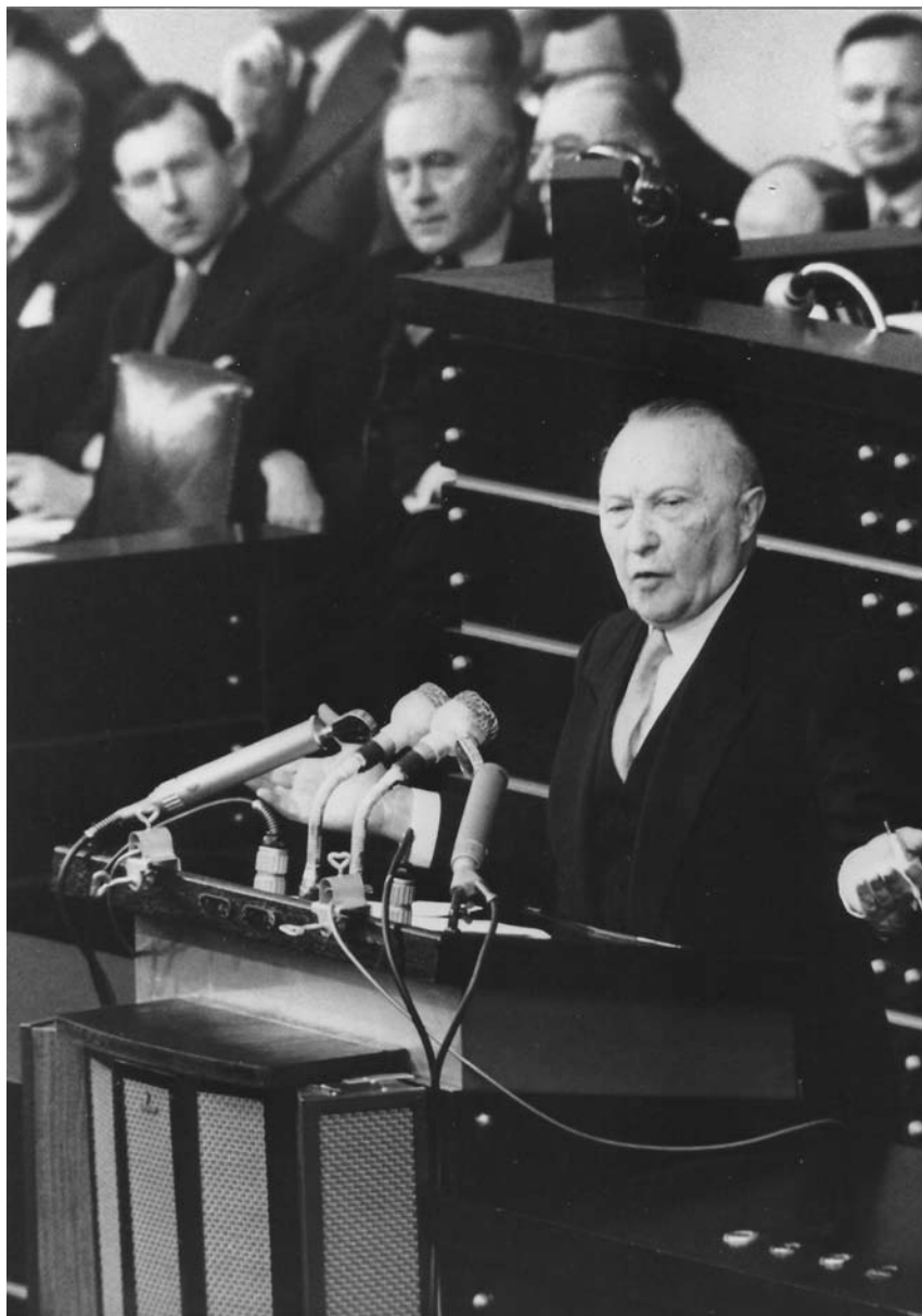
Prilikom obraćanja Bundestagu 1954. godine