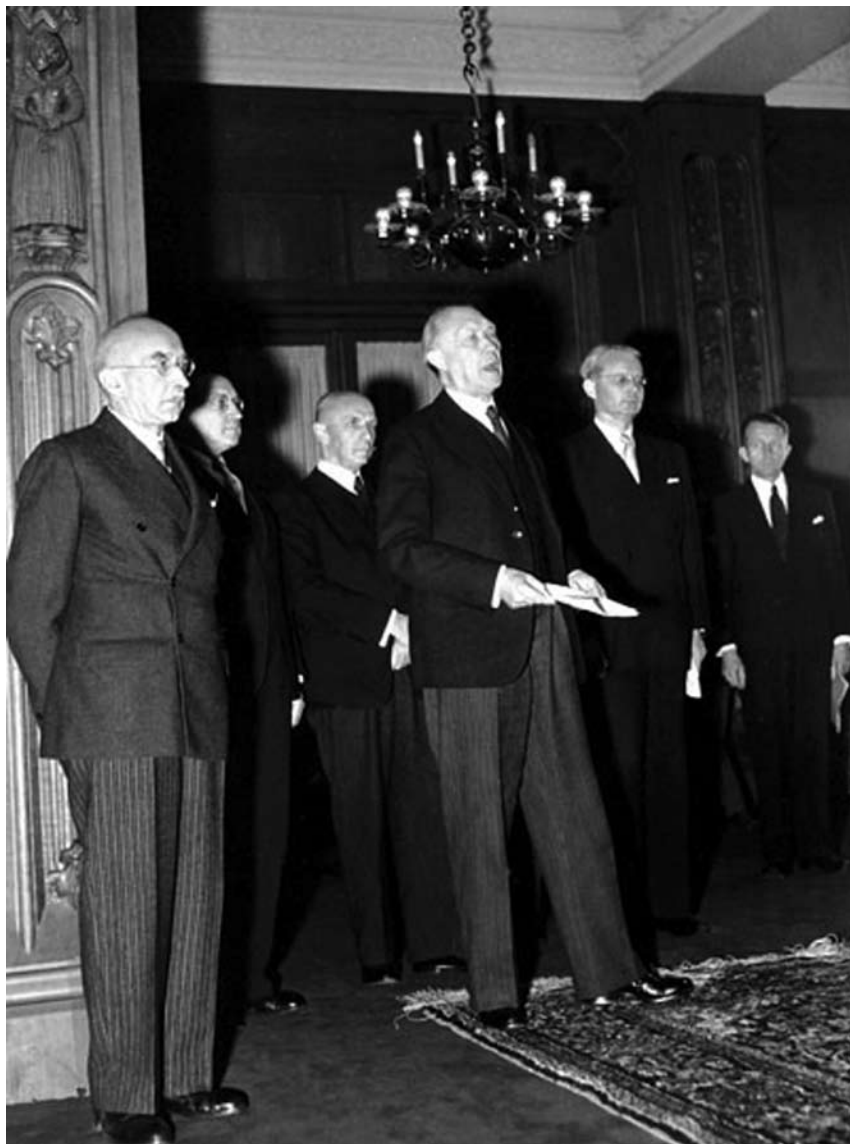
Prilikom predstavljanja članova svog kabineta pred Visokim predstavnicima okupacionih sila – momenat stupanja na tepih, septembar 1949. godine.