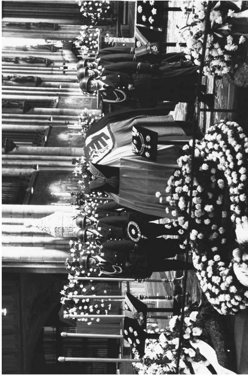
Oproštaj od Adenauera u katedrali u Kelnu, 25. april 1967. godine