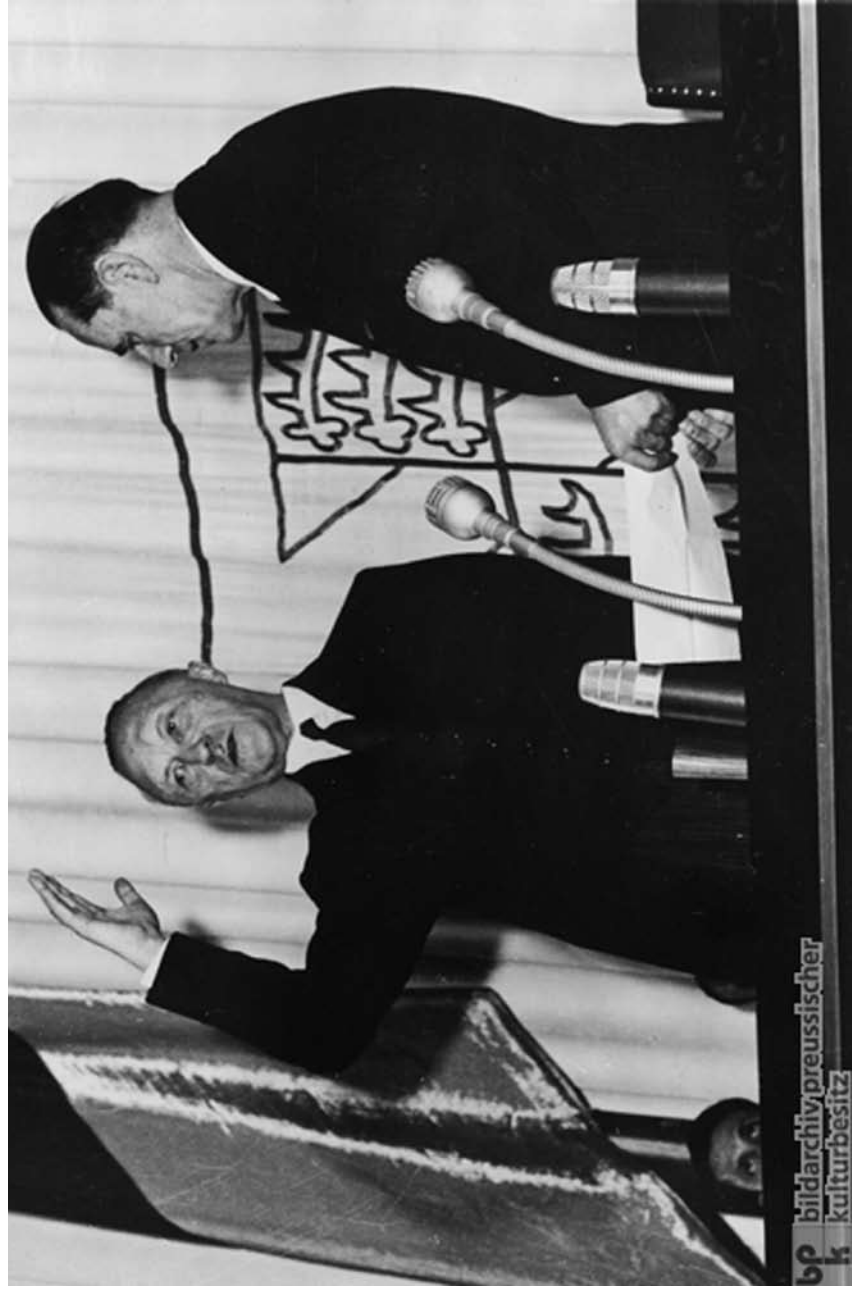
Inauguracija Konrada Adenauera kao prvog kancelara Savezne Republike Nemačke, 15. septembar 1949. godine