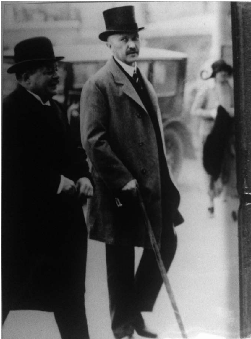
Sa predsednikom Nemačke Fridrihom Ebertom, Keln, 11. maj 1924. godine