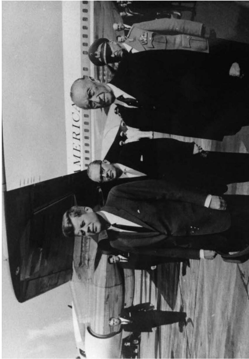
Omiljeni sport, avgust 1960. godine