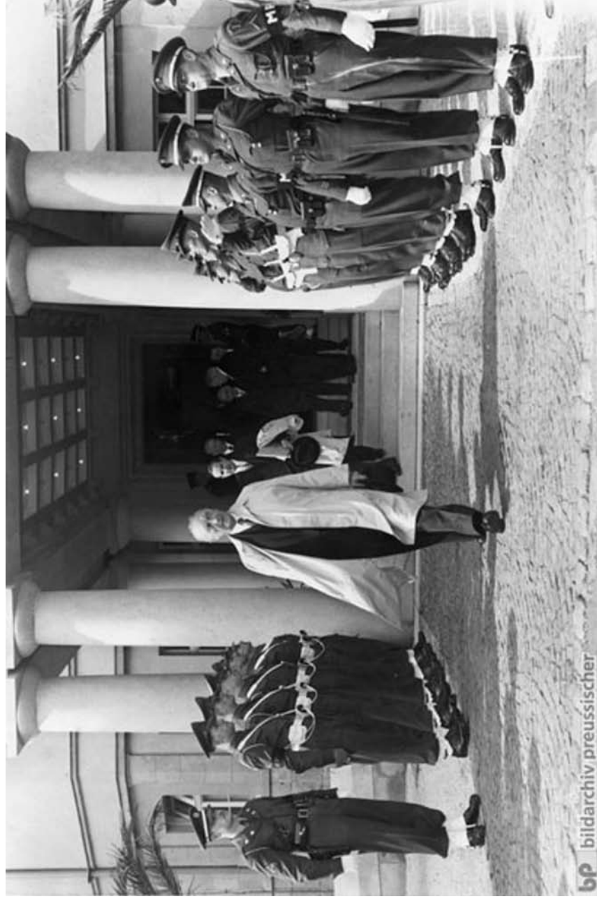
Napuštajući sedište Visokih predstavnika okupacionih sila na Petersbergu nakon dobijanja novog Okupacionog statuta, 21. septembar 1949. godine