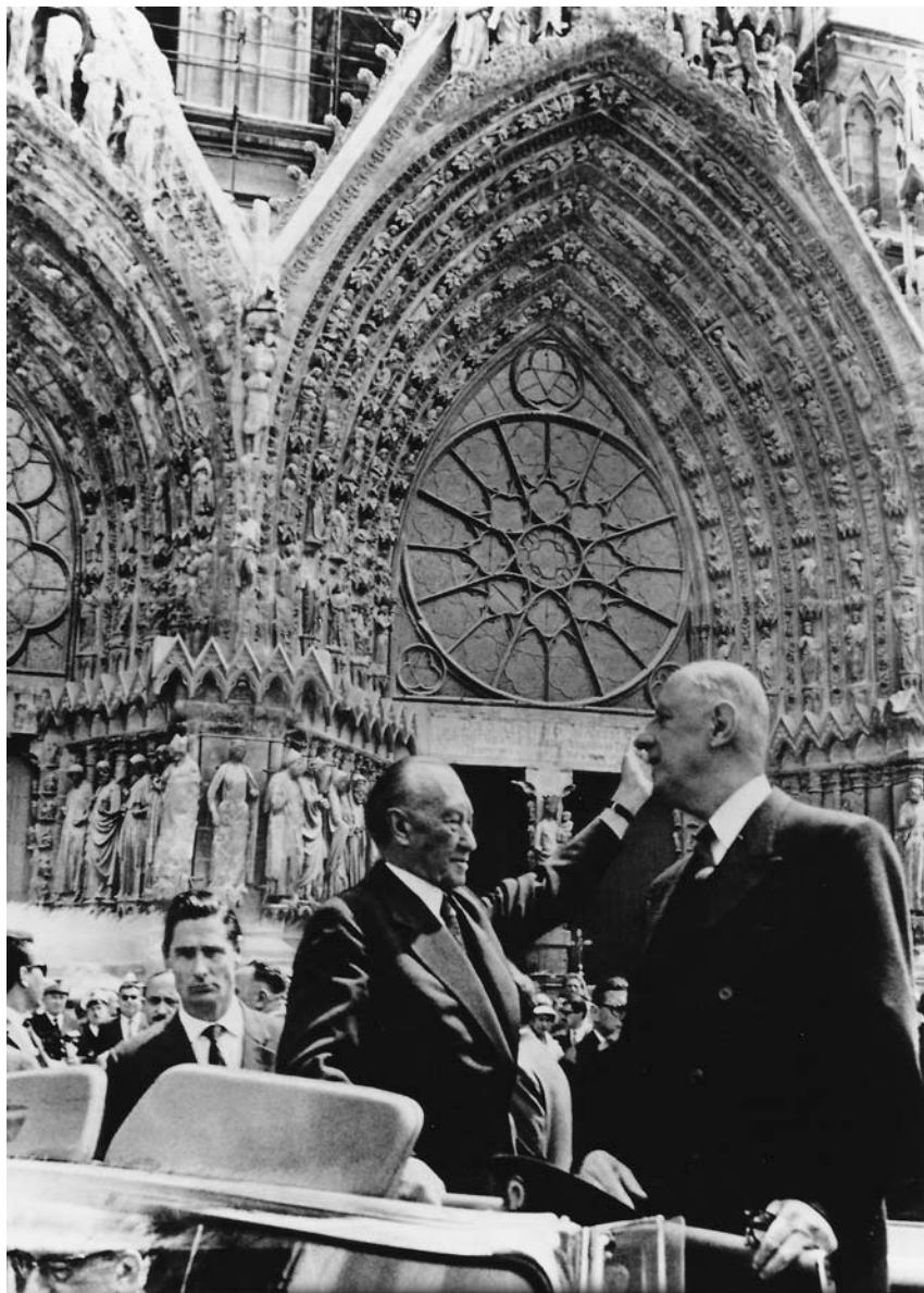
Ispred katedrale Reims u Francuskoj, 8. jul 1962. godine