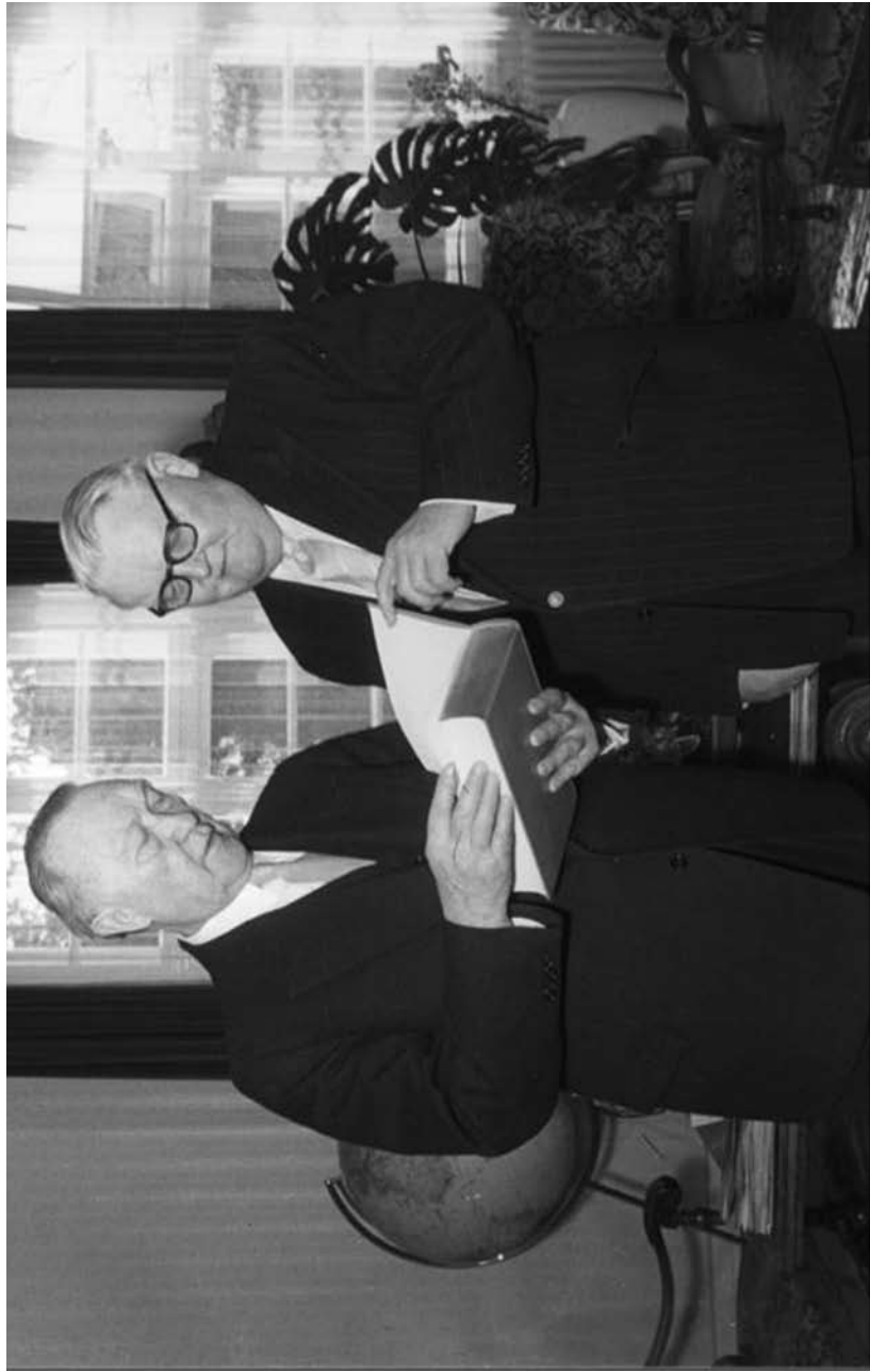
5. Januar 1956

Konrad Adenauer i Ludvig Erhard, 15. januar 1956. godine