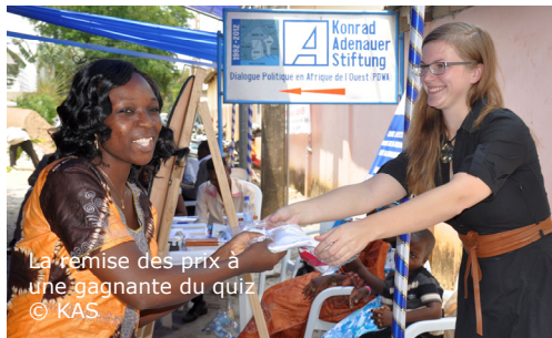
La remise des prix à une gagnante du quiz

LA JOURNEE PORTES OUVERTES DE LA FONDATION KONRAD ADENAUER A COTONOU