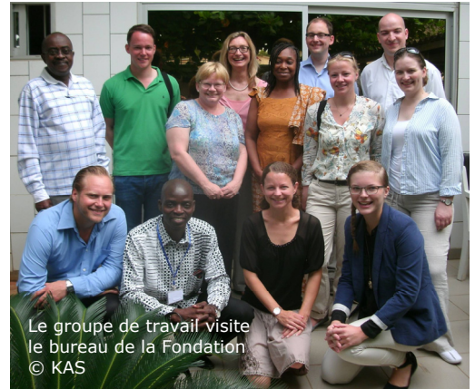
Le groupe de travail visite le bureau de la Fondation

Du 17 au 21 juillet 2013, le groupe de travail des « Jeunes Experts d'Affaires Etrangères » de la Fondation Konrad Adenauer a visité le Bénin. Après un colloque préparatoire en janvier à Berlin, les participants ont souhaité discuter et connaître les réalités ouest-africaines sur place. Des photos sont maintenant disponibles sur notre site web .