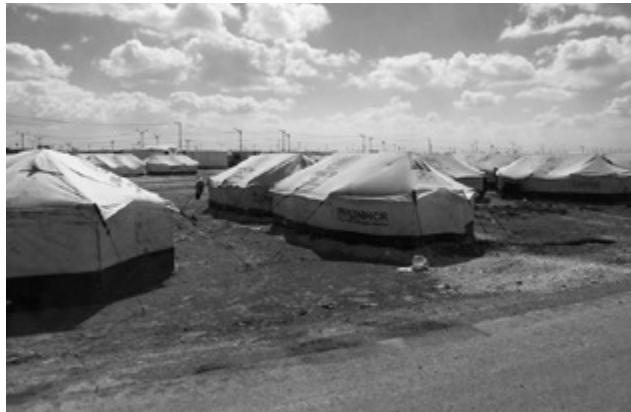
Wohnzelte im Flüchtlingslager Zaatari: Mit mehr als 120.000 Bewohnern ist das Lager die fünftgrößte Stadt Jordaniens.

Ursprünglich soll das UNHCR beabsichtigt haben, im Libanon 15 insgesamt 18 Flüchtlingslager zu errichten – zwölf mit einer Kapazität von 100.000 Personen, weitere sechs mit einer Kapazität von 15.000 Personen. Dazu ist es aus politischen Gründen bislang nicht gekommen. Die schiitische Hisbollah, die wohl nicht nur befürchtet, dass die Mehrheitlich sunnitischen Flüchtlinge lange im Libanon bleiben, hat die Errichtung der Lager verhindert. Angesichts der erdrückenden Zahl syrischer Flüchtlinge erwägt das UNHCR nun aber doch, drei Flüchtlingslager zu errichten, ein Lager bei Chaat in der nördlichen Bekaa-Ebene, zwei weitere bei Joub Janine und Tall Zhouh in der westlichen Bekaa-Ebene. Diese Pläne sind nicht unproblematisch angesichts der Tatsache, dass die Bekaa-Ebene von der Hisbollah dominiert und kontrolliert wird. 16