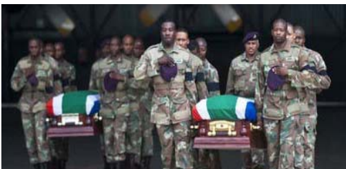
Die Leichname der gefallenen südafrikanischen Soldaten werden in die Heimat überführt.