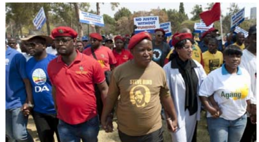
Julius Malema (Mitte) Hand in Hand mit Vertretern anderer Oppositionsparteien.