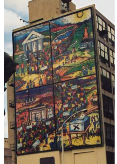
Wandbild in Kapstadt zu den ersten freien Wahlen von 1994

Am 27. April 2013 feierten die Südafrikaner zum 19. Mal ihren Freedom Day . Der Freiheitstag ist in Gedenken an die ersten freien Wahlen von 1994 einer der wichtigsten nationalen Feiertage Südafrikas. Damals durften erstmals in der Geschichte des Landes alle Bürger ungeachtet ihrer Hautfarbe in freien, allgemeinen und gleichen Wahlen ihre Stimme abgeben. Unter der Apartheid wurde der nichtweißen Bevölkerungsmehrheit mit dem Verbot der politischen Beteiligung eines der wichtigsten Grundrechte moderner Demokratien verwehrt. Entsprechend hoch lag die Wahlbeteiligung an jenem Tag als Präsident Mandela zunächst für eine zweijährige Übergangszeit zum ersten schwarzen Präsidenten Südafrikas gewählt wurde. Der Freedom Day wurde auch in diesem Jahr wieder landesweit mit zahlreichen Veranstaltungen gefeiert.