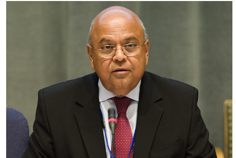
Minister Pravin Gordhan