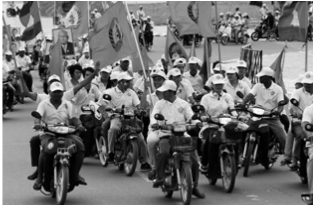
Unterstützer der kambodschanischen Volkspartei: Angesichts der turbulenten Geschichte Kambodschas gilt gesellschaftliche Stabilität als hohes Gut.

die Regierung sei den Forderungen nicht nachgekommen. 39 Ein ernst zu nehmender Kritikpunkt ist außerdem die jährliche Vergabe von Landkonzessionen an ausländische Investoren, welche oft die gesetzlich geregelte maximale Grundstücksfläche von 10.000 ha übersteigen. Diese Konzessionen werden teilweise unter Geheimhaltung verhandelt und bringen zum Teil gravierende ökologische, ökonomische und humanitäre Schäden mit sich. Sie werfen einige Fragen auf und rücken den Mangel an Aufklärung (Warum sind die Konzessionen im nationalen Interesse?) und den unzureichenden Einbezug der Öffentlichkeit in den Blickpunkt.