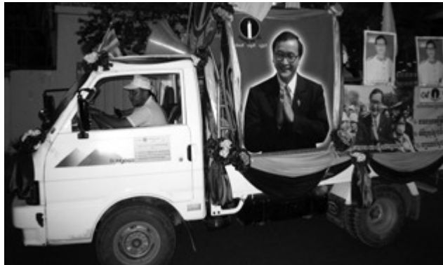
„Mr. Clean“: Sam Rainsy hat wiederholt Anti-Korruptions-Kampagnen lanciert.

Das Gewicht, das diese Wähler im Ausgang der Wahl hatten, sollte jedoch nicht überschätzt werden. Ausdruck des Bedauerns über die Allgegenwart der Korruption im Land ist nicht unbedingt gleichzusetzen mit einer Stimmabgabe für die Opposition: 57 Prozent der Befragten sagten in einer Umfrage von Transparency International, dass sie die Anti-Korruptions-Maßnahmen der Regierung für „effektiv“ hielten. 43 Diese Tendenz ist jedoch nach Ansicht der NGO ein sich wiederholendes Muster in den ersten Jahren nach der Einführung solcher Kampagnen. Die Anti-Korruptionseinheit, als großer Schritt im Kampf gegen die Korruption angekündigt und im Jahr 2010 mit großem Pomp auf die Beine gestellt, muss seither mit einer chronischen Unterfinanzierung und staatlicher Kontrolle kämpfen, was ihre Wirksamkeit weitgehend einschränkt.