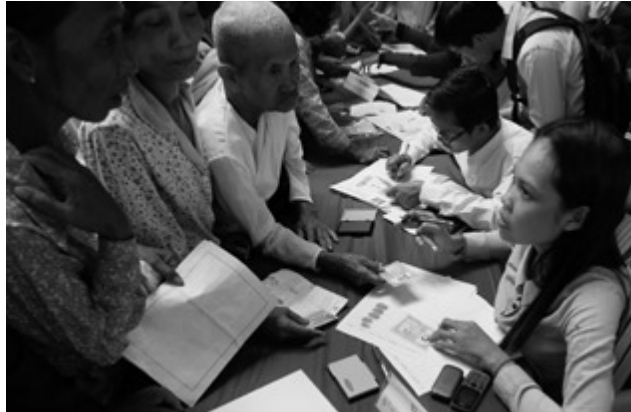
Andrang im Wahlbüro: Wichtigstes Wahlargument war die Entwicklung des Wirtschaftswachstums.

Parteienfinanzierung. 13 Diese Argumente wurden immer wieder angeführt, um den Erfolg der CPP bei Wahlen und ihre Dominanz im politischen Alltag allgemein zu erläutern. Für die Erklärung des diesjährigen Wahlausgangs sind diese Argumente jedoch nur begrenzt tauglich. Dazu müssen weitere Erklärungen herangezogen werden.