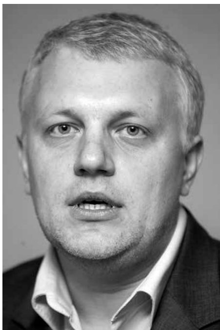
ПАВАЛ ШАРАМЕТ / ПАВЕЛ ШЕРЕМЕТ / PAVAL SHARAMET