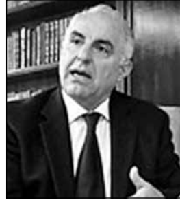
LUIS SOLARI DE LA PUENTE Ex Presidente del Consejo de Ministros.

E l problema más importante es que, debido a la caída del Muro de Berlín, estamos en una situación de cambios con tres características. Es amplio, como si fuera una neblina que va avanzando. Es rápido, las cosas cambian a una gran velocidad. Además, es complejo, eso significa que con estas tres características se necesita gente que esté acostumbrada a manejar situaciones de este tipo.