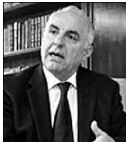
LUIS SOLARI DE LA PUENTE Médico, Ex Presidente del Consejo de Ministros.

Y o soy de los que comparten la tesis de que la caída del Muro de Berlín ha dado inicio a un proceso, cuya primera etapa ni siquiera termina. Y probablemente termine entre el 2025 y el 2030, cuando en el 2025 China supere en gastos de defensa a Estados Unidos y sea el último punto en el que lo supere. En ese momento, América Latina será un mix de inversión árabe, china, europea, rusa.