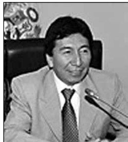
HILDEBRANDO TAPIA Parlamentario Andino.

H oy nos toca hablar de inclusión social, un tema muy de moda en todos los foros nacionales e internacionales, porque es un tema sensible. Un tema al que hay que darle una solución objetiva y, sin embargo, tener cuidado con el populismo extremo. Hablar de inclusión social no solo es referirse a la educación, la salud o el interés en la infancia, sino a una buena calidad de vida de los ciudadanos.