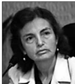
CARMEN VILDOSO Socióloga. Ex Ministra de la Mujer

S i se trata de concentrarnos en el período reciente de gobierno, y en este primero año de gobierno, una de las novedades que hemos tenido es la creación de un Ministerio del tema que nos ocupa: el Ministerio de Inclusión Social. Entonces, quiero compartir algunas cuestiones, que prácticamente son el ABC de este Ministerio. ¿Qué es la inclusión social? Es la situación que asegura que todos los ciudadanos, sin excepción, puedan ejercer sus derechos, aprovechar sus habilidades y tomar en ventaja las oportunidades que encuentran en su medio. Luego se presenta un mapa de la población en proceso de inclusión. La inclusión por antonomasia para este mapa abarca a la población que vive en hogares con tres o más circunstancias asociadas a los procesos de exclusión, que son cuatro: ámbito de residencia (pro-rural), etnicidad (quechua, aymara nativa, educación de la madre (puede ser jefe de familia o cónyuge con primaria incompleta o menos), nivel socioeconómico (primer quintil de gasto del hogar).