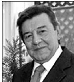
RAFAEL RONCAGLIOLO Ex Ministro de Relaciones Exteriores.

M uchas gracias por la presentación. Me da mucho gusto participar en este Foro. Bueno, voy a ser muy breve, pues me imagino que va a ser mucho más rico el diálogo que tengamos. Voy a limitar mi exposición a tres puntos: Los propósitos de la política exterior, los ejes de la política exterior peruana y las características principales del contexto internacional actual.