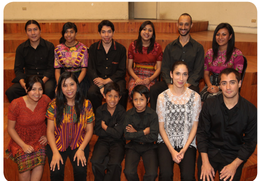
Compositor, solistas, maestros, niños y jóvenes integrantes de la Orquesta Nacional Juvenil Intercultural, febrero 2013.

Resultado esperado: 1) Capacitar aproximadamente a 90 jóvenes que integrarán la Orquesta Nacional Juvenil Intercultural, provenientes de las distintas regiones del país, con el apoyo de tres docentes de reconocido prestigio a nivel internacional, que auspicia la Fundación Konrad Adenauer. 2) Presentar un concierto al final de cada campamento, ya sea en la ciudad capital, en la Antigua Guatemala o en Quetzaltenango y concluir el proyecto con el recibo de una invitación para participar en el festival de Beethoven en la ciudad de Bonn, Alemania, bajo el patrocinio de la DW - Deutsche Welle. 3) El proyecto apoyará a los jóvenes participantes a reforzar los conocimientos adquiridos para que sean ejemplos multiplicadores dentro de sus familias y comunidades de origen.