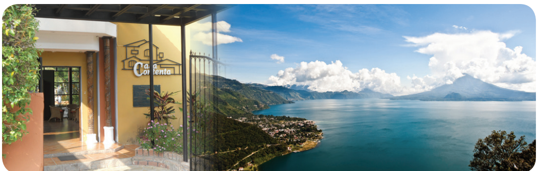
Fotografía: Vista del área donde se llevará a cabo el primer campamento de la ONJI, Marzo 2014. Panajachel Sololá.