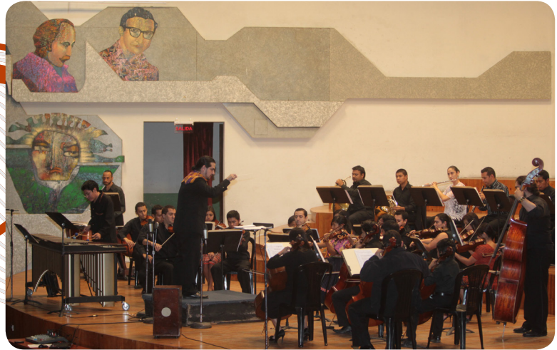
Miembros de la Orquesta Nacional Juvenil Intercultural durante interpretación en el Conservatorio Nacional de Guatemala, febrero 2013.