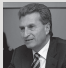
Günther H. OETTINGER