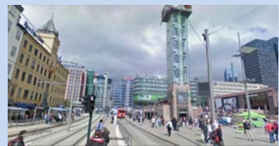
התמונה והמידע לקוחים מאתר "Greenuptown"

הזו, שבעבר הופעל על-ידי נפט, נעשה באמצעות אנרגיות מתחדשות וכל האוטובוסים עושים שימוש בביו-דלקים. אוסלו היא אחת הערים עם הרמה הנמוכה ביותר של פליטות גזי חממה. 85% מהתלמידים בעיר מגיעים לבית הספר באמצעות הליכה ברגל, רכיבה על אופניים או נסיעה באחד האוטובוסים המונעים מאנרגיות נקיות, ו-94% ממשקי הבית מבצעים הפרדה מלאה של הפסולת. אחד מסודות ההצלחה של היא הרמה הגבוהה והיציבה של שותפות בין הציבור והרשות המקומית בנושאים אלה.