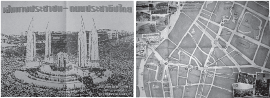
เส้นทางประชาชน ถนนประชาธิปไตย

แผนที่สำคัญลำดับเหตุการณ์ วัน เวลา และสถานที่ของประวัติศาสตร์การเมืองไทย