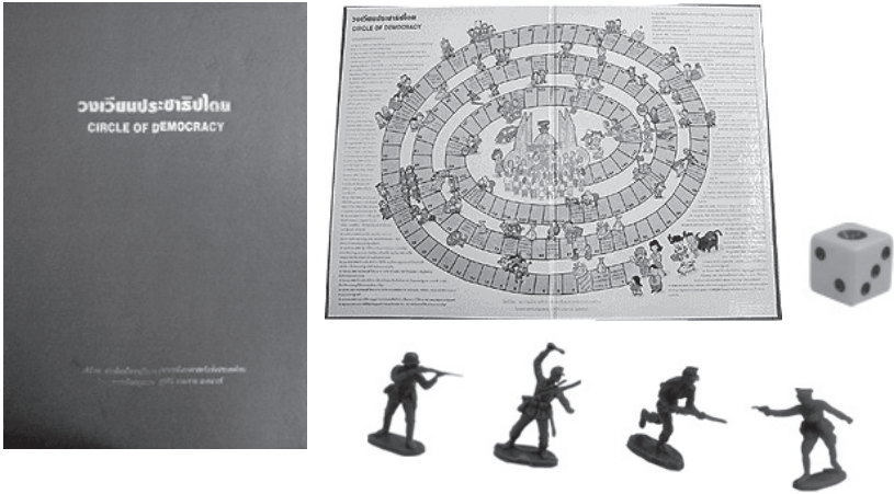
เกมวงเวียนประชาธิปไตย

นอกจากนั้นยังมีปัญหาอีกมากมาย เช่น เรื่องปัญหาการแก่งแย่งทรัพยากร น้ำ ในเรื่องของที่ดิน ในเรื่องของการบุกรุกที่ ในเรื่องต่างๆ เราสามารถที่จะรวบรวมกรณีศึกษา มา เรื่องสมัชชาคนจน เรื่องเขื่อนปากมูล ฯลฯ เราสามารถที่จะพัฒนา มาเป็นกรณีศึกษาแล้วให้นักเรียนหรือให้ผู้ที่เข้ามา ร่วมสามารถที่จะแลกเปลี่ยนความคิดเห็นกันได้