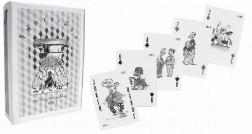
เกมไพ่การเมือง

ในวันนี้ผมก็อยากจะพูดถึง 2 เรื่องด้วยกัน คือเรื่องเนื้อหาสาระ หรือแนวทางของการให้ การศึกษาเพื่อสร้างพลเมืองในสังคมประชาธิปไตย และที่จะเน้นก็คือเรื่องของวิธีการ