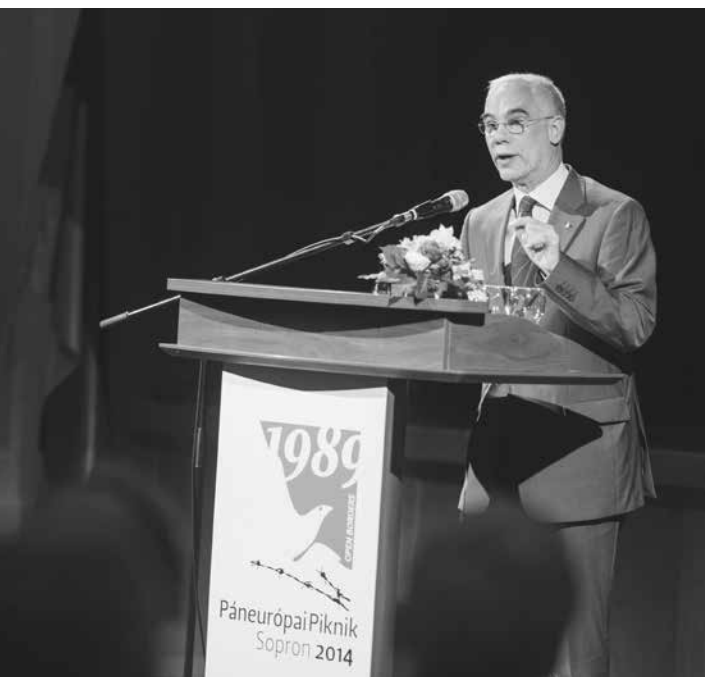
Balog Zoltán, az emberi erőforrások minisztere beszéd közben.

Beszédében hangsúlyozta, mennyire fontos a német-magyar barátság, mely nemcsak a két nemzet messzire visszanyúló közös történelmi gyökerein alapul, hanem azon a tényen is, hogy mindkettejüknek két diktatúra terhes örökségével kell szembenéznie. Éppen ezért fejezte ki azon reményét, hogy Németország több megértést tanúsít Magyarország iránt, mint a többi nyugat-európai ország, melyek sokszor értetlenséggel fogadják a magyarok által választott utakat.