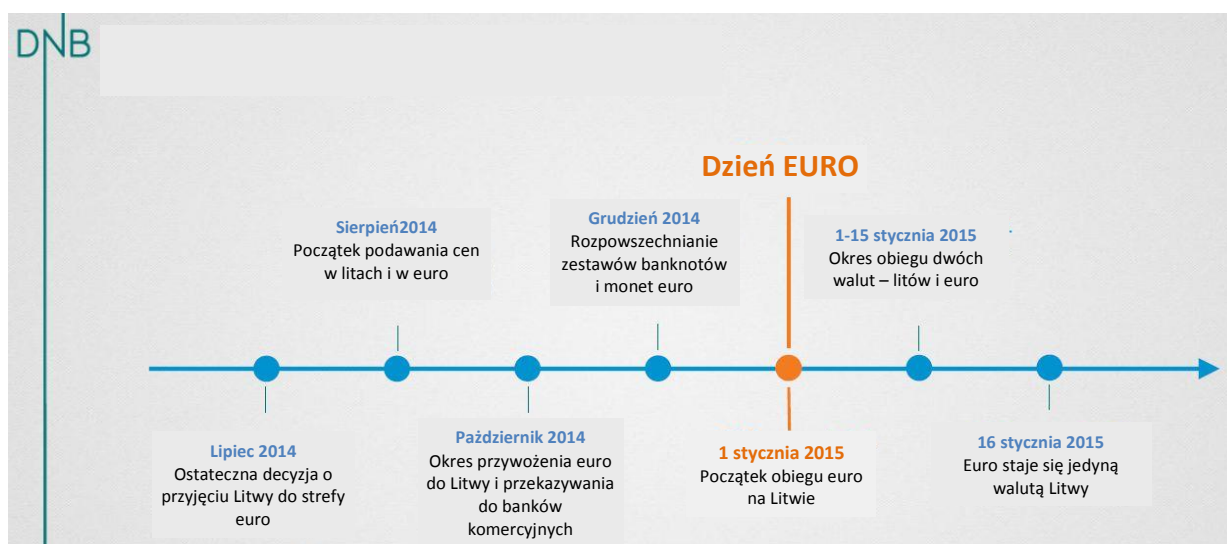
Schemat 2. Kalendarz wdrażania euro na Litwie 22

Powyższy schemat przedstawia terminy wdrażania euro. Jednak badania wskazują, że mieszkańcy kraju najbardziej odczuli rządowe działania w tej sferze, gdy w sierpniu 2014 r. sektor handlowo-usługowy rozpoczął powszechne podawanie cen w dwóch walutach (w litach i euro). Duże centra handlowe rozpoczęły tę praktykę już w czerwcu 2014 r. Następnym etapem większego zaangażowania mieszkańców w procesy wdrażania nowej waluty był grudzień, kiedy rozpoczęto rozpowszechnianie banknotów i monet euro, dostarczanie ich do przedsiębiorców oraz planowanie zapotrzebowania na pierwsze tygodnie 2015 roku.