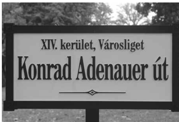
A Konrad Adenauer út a budapesti Városligetben található.