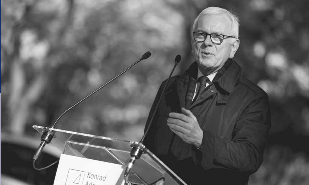
Dr. Hans-Gert Pötering, az Európai Parlament volt elnöke, a Konrad-Adenauer-Stiftung elnöke.