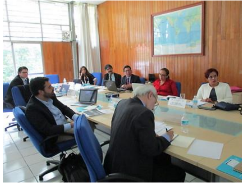
Especialistas em debate

O workshop foi realizado nas instalações da Escuela de Ingeniería y Arquitectura (ESIA) na Cidade de México – México. Este workshop teve como objetivo principal obter uma visão geral da segurança energética na América Latina, a partir das perspectivas dos expertos presentes no workshop, assim como impulsionar o debate sobre as questões energéticas frente às mudanças geopolíticas que ocorrem na região.