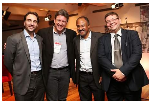
Representantes de cidades brasileiras.