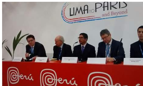
Especialistas em energia da América Latina na Alemanha e na COP21 na França