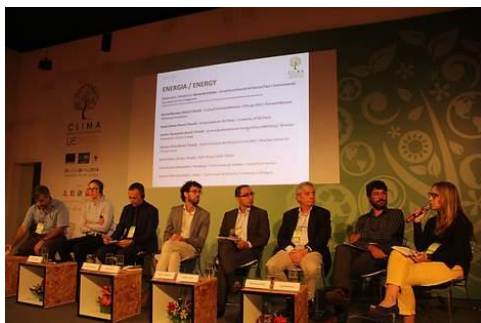
Perguntas e comentários.