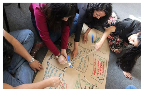
Dinâmica grupal sobre INDCs