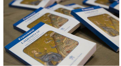
Encíclica Laudato Si.