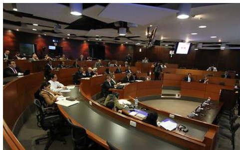
Dia 1: Seminário especializado em energia renovável