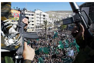
Demonstration in Gaza

Eine neue Ära der Gewalt im Nahen Osten ist angebrochen. Der 67jährige geistliche Führer der Hamas, Scheich Ahmad Yassin, wurde in den frühen Morgenstunden des 22. März 2004 nach seinem Morgengebet in der Al-Sabra-Moschee, Gaza-Stadt, auf Anweisung des israelischen Regierungschefs Sharon durch Raketen getötet.