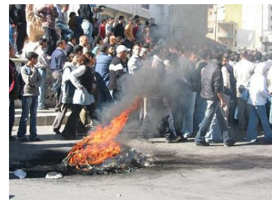
Brennende Reifen in Ramallah

Mit der Tötung von Yassin ist eine neue Ära im palästinensisch-israelischen Konflikt angebrochen. Die ohnehin ins Stocken geratene Road Map ist endgültig gestorben. Die Autonomiebehörde steht vor den Scherben dessen, was einst ein Staat werden sollte. Kurzfristig wird es in den palästinensischen Gebieten um Chaos- und Gewaltmanagement gehen. Mittelfristig ist es zu hoffen, dass es der Autonomiebehörde gelingen wird, Hamas und ihre Anhänger unter Kontrolle zu bringen.