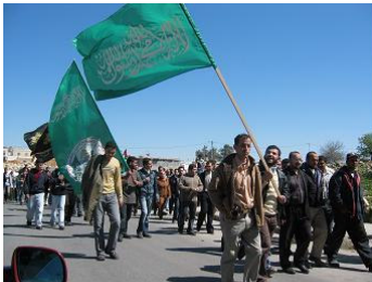
Sympathisanten in Ramallah

Die politische Führung der Hamas operiert erfolgreich auf einem grass-root-level in der palästinensischen Gesellschaft und ist für die militärische und strategische Planung der Organisation verantwortlich, während der militärische Arm (Kassem-Brigaden) für die Ausführung von Anschlägen zuständig ist, bei denen bisher 377 Israelis getötet wurden.