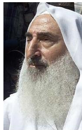
Scheich Ahmad Yassin

Yassin kam 17. Juni 1936 in Dschura, südlich von Ashqelon, heutiges Israel, zur Welt. Während des israelischen Unabhängigkeitskrieges 1948 floh der damals 12-Jährige mit seiner Familie nach Gaza. Dort brach er sich 1952 nach eigenen Angaben bei einem Tauchunfall das Rückrat und war seitdem an den Rollstuhl gebunden. Trotz seiner Behinderung beendete er seine Schulausbildung in Gaza und begann das Studium an der Kairoer Universität. Aus Geldmangel brach er das Studium vorzeitig ab, trat allerdings noch 1955 als Student einer verbotenen Moslembroderschaft bei.