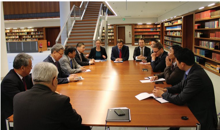
ХБНГУ-ын Гадаад Хэргийн Яамны Монгол улсыг хариуцсан референт болон АСЕМ-ыг хариуцсан референтүүдтэй хийсэн уулзалт