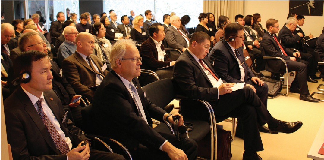
Монгол-Германы XIII Чуулганы оролцогчид Конрад-Аденауэр-Сангийн Академийн байрнаа