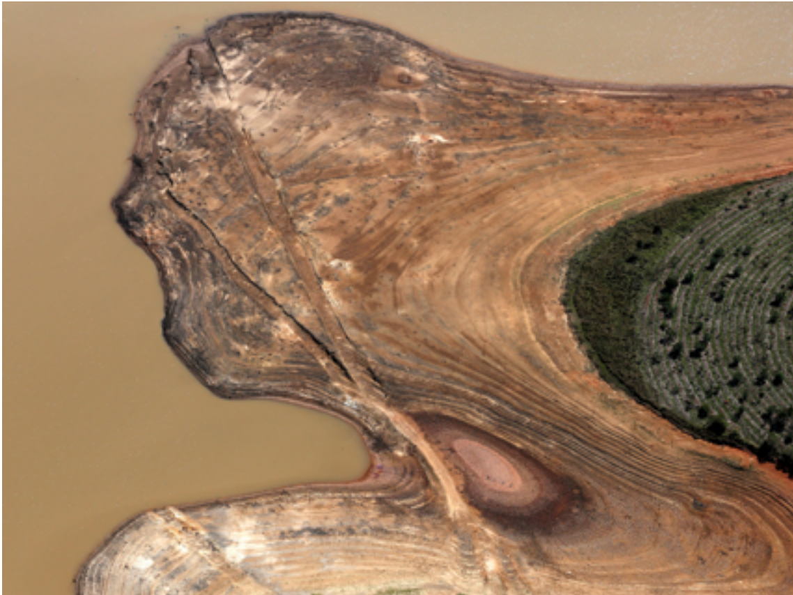
Trockenzeit: Diese Luftaufnahme zeigt den Atibainha-Staudamm, Teil des Cantareira-Systems, im Jahr 2014 während der schlimmsten Trockenperiode seit 80 Jahren und dem niedrigsten Wasserstand seit Beginn der Aufzeichnungen.

Brasilien und Mexiko fossile Energieträger wie Gas oder Öl als Alternative zur Wasserkraft für die Stromgewinnung in Betracht ziehen. In der Folge könnte aus einem der CO 2 -neutralsten Stromversorgungssysteme der Welt ein CO 2 -intensives Stromversorgungssystem werden.