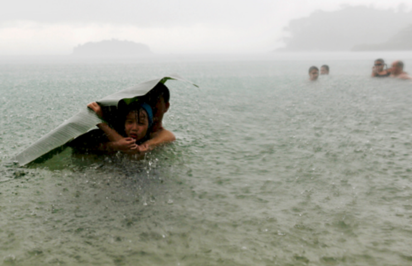
Ein Bananenblatt als (kläglicher) Notbehelf gegen die Regenmassen am Rande der Stadt Colón in Panama.

Auch die Wasserversorgung in den nicht andinen Regionen verschlechtert sich. Im Amazonasbecken plagen häufiger auftretende Dürren und extreme Überschwemmungen die bestehenden Wasserversorgungsstrukturen. Insgesamt ist zu beobachten, dass die sehr trockenen und wüstenartigen Küsten Chiles und Perus am Pazifik mit noch weniger Wasser auskommen müssen, während die regenreichen Gebiete im Amazonas- und La Plata-Becken in Uruguay, Paraguay, Nordargentinien und Südbrasilien mit extremen Niederschlägen konfrontiert sind.