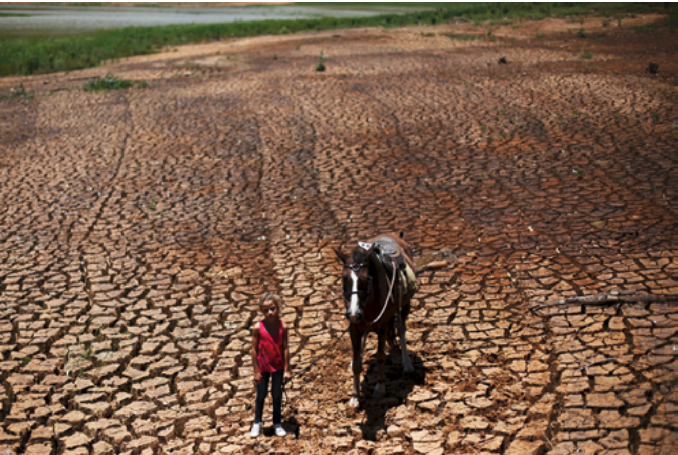
Auf dem Trockenen: Heftige Dürreperioden setzen Lateinamerikas Flora und Fauna zu und stellen die Bevölkerung nicht selten vor große Herausforderungen, wenn es darum geht, den Alltag zu meistern.

Mit der klimabedingten Ausweitung der landwirtschaftlichen Nutzflächen können auch bestehende gewalttätige Konflikte um Land an Schärfe