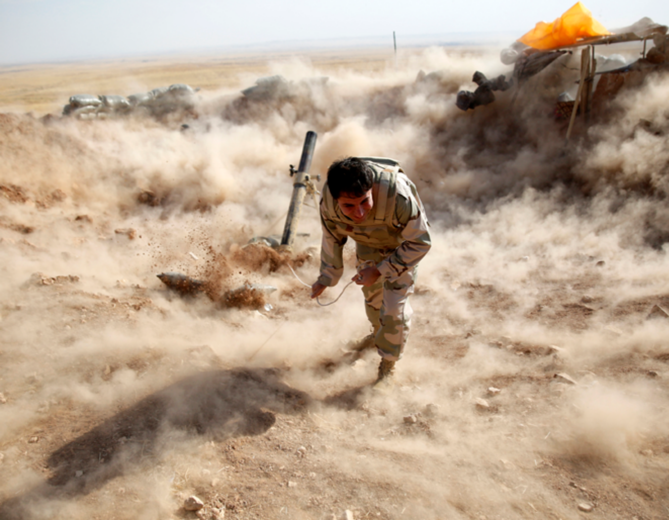
Peschmerga-Mörser: Im Norden des Irak kämpfen kurdische Peschmergakämpfer gegen den IS. Sie werden unter anderem von Bundeswehrsoldaten ausgebildet.

ten in Syrien und Irak eine zentrale Bedeutung zu. Die von Riad im Dezember 2015 gegründete Islamic Military Alliance to Fight Terrorism hingegen ist als militärischer Akteur bis dato kaum in Erscheinung getreten und scheint den Saudis eher als Gegengewicht zum Hegemoniestreben Irans in der Region zu dienen. 11