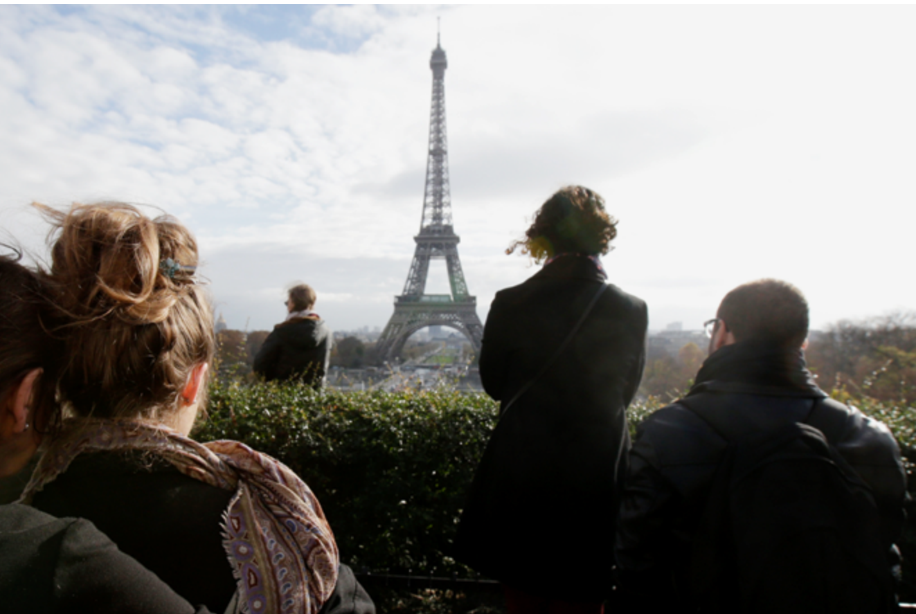
Gedenken: Die Terroranschläge am 13. November 2015 in Paris, zu denen sich der IS bekannt hat, waren die schlimmsten seit mehr als zehn Jahren.

werden mit Haftbefehl gesucht. 46 Aber selbst wenn der Aufenthaltsort der Gefährder bekannt ist, gibt es aufgrund von Personalengpässen keine lückenlose Überwachung, sodass mittlerweile eine Priorisierung anhand des Gefährdungspotenzials vorgenommen werden muss. Etwa 80 Prozent der Hinweise, die zur Zerschlagung von islamistischen Strukturen oder sogar zur Vereitelung unmittelbar bevorstehender Anschläge führten, wurden von ausländischen Nachrichtendiensten an die deutschen Sicherheitsbehörden weitergegeben. 47 Der personellen und materiellen Aufstockung der deutschen Sicherheitskräfte kommt somit weiterhin eine hohe Priorität zu. Dies ist umso drängender, da viele der etwa eine Million Flüchtlinge in Deutschland zunächst nur unzureichend erfasst und überprüft worden sind. Zudem sollte