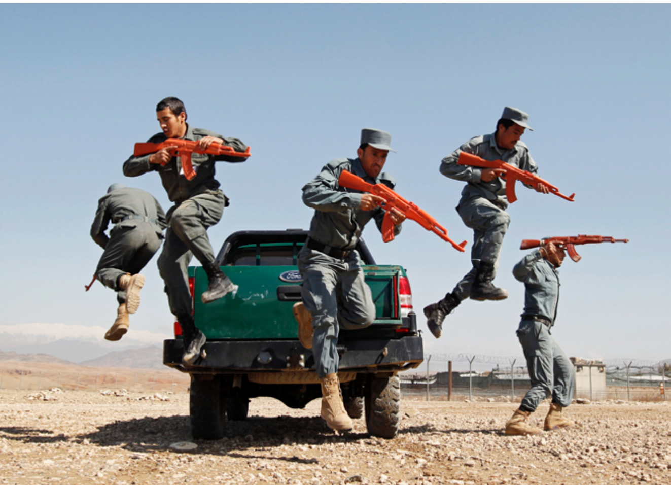
Trockenübung: In Afghanistan ist es lokalen Sicherheitskräften mit US-Unterstützung gelungen, den IS auf ein kleines Gebiet im Osten des Landes zurückzudrängen.

in Nordostsyrien herbeigeführt hat, seinen Rückhalt in der Bevölkerung zu entziehen. Verschärft wird die Situation durch die Tatsache, dass die aktuelle Offensive auf die mehrheitlich von sunnitischen Arabern bewohnten Gebiete um Rakka von der kurdischen YPG angeführt wird. Diese dominieren zahlenmäßig die SDF, in deren Rängen es immer wieder zu Konflikten zwischen Arabern und Kurden gekommen ist. 22 Eine Rückeroberung der Gebiete durch die Armee des Assad-Regimes, die zeitgleich mit den SDF eine Offensive in der Provinz Rakka gestartet hat, wird ebenfalls auf großes Misstrauen stoßen. Ohne den Rückhalt der lokalen Bevölkerung laufen die Vorstöße Gefahr, diese weiter in die Arme des IS zu treiben.