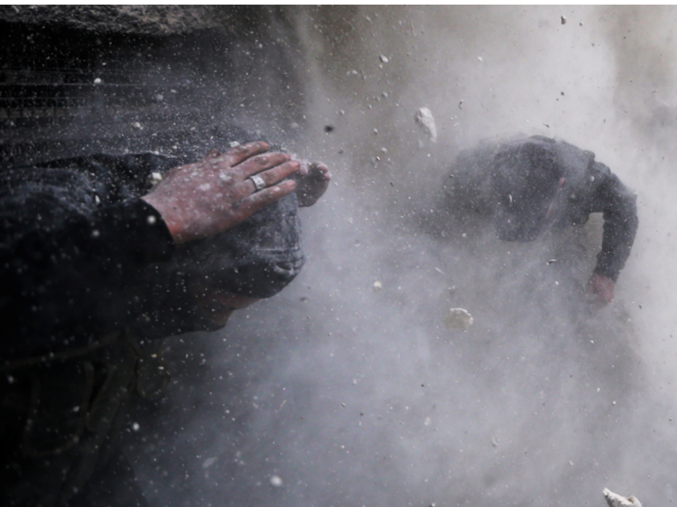
Der Bürgerkrieg in Syrien hat bereits jetzt Hundertausende Menschen das Leben gekostet und maßgeblich zu einer der größten Flüchtlingskatastrophen der Neuzeit beigetragen.