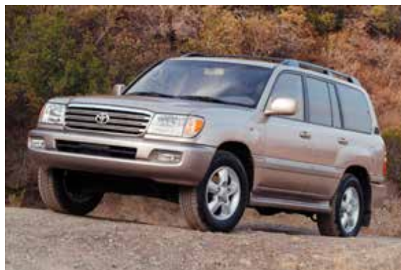
Фотографія LandCruiser 100 (2005)

Вартість такої автівки становить кратно більшу суму, від 80 000 доларів. Тому виникає цілком логічне запитання, хто і навіщо продав новий Toyota Land Cruiser за ціною, що в чотири рази нижче ринкової?