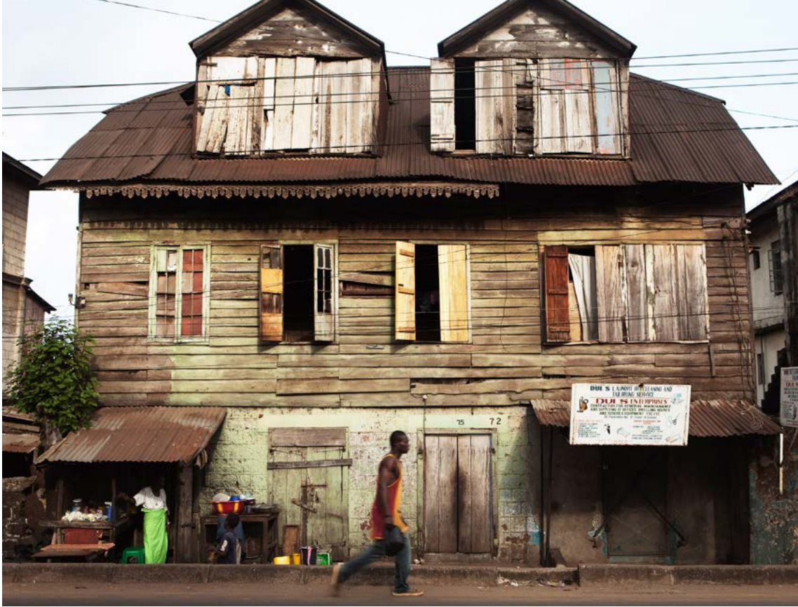
Kolonialstil: Der Kolonialismus hat nicht nur in Sachen Grenzziehung seine Spuren hinterlassen.

Mauer. In Ostafrika kam es 1961, 1964 und erneut von 1977 bis 1978 zwischen Somalia und Äthiopien aufgrund offener Grenzfragen zu Kämpfen. Äthiopien und Eritrea führten von 1998 bis 2000 Krieg gegeneinander. In Westafrika trugen Mali und Burkina Faso 1975 sowie von 1985 bis 1986 Grenzkriege aus. Die Bakassi-Halbinsel war von Mitte der 1970er bis Mitte der 1990er Jahre Gegenstand eines solchen Krieges zwischen Nigeria und Kamerun. Analoges ereignete sich 1983 zwischen Nigeria und dem Tschad. Senegal und Mauretanien kämpften von 1989 bis 1990 gegeneinander, 6 und Ghana sowie Côte d'Ivoire beanspruchen derzeit beide den Besitz der Öl- und Gasvorkommen entlang ihrer Seegrenze. 7 Ein Großteil dieser Grenzkonflikte wurde durch die Entdeckung grenzübergreifender Vorkommen strategisch wichtiger Rohstoffe verschärft.