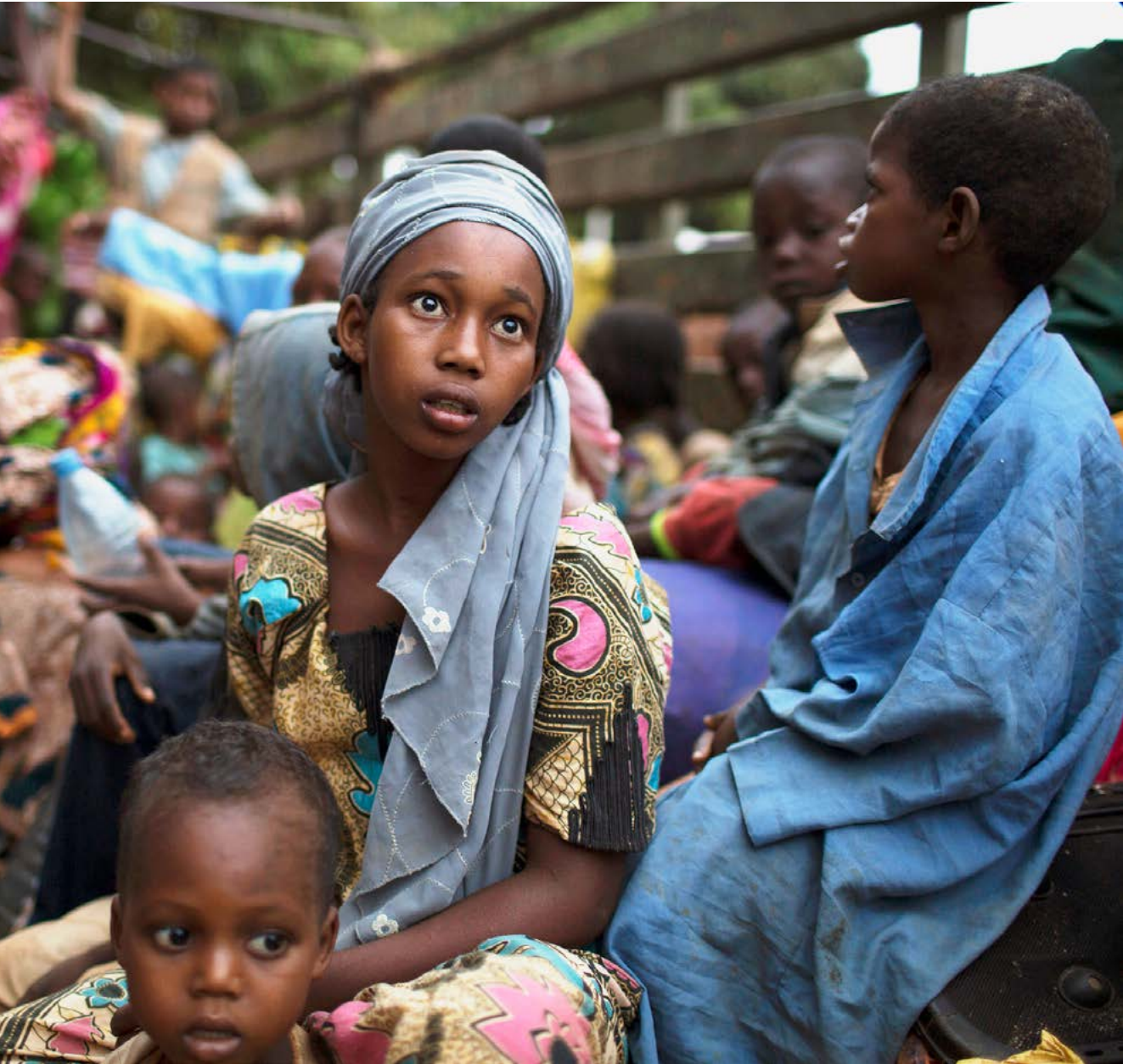
Flucht: Unter anderem wegen einer Vielzahl kriegerischer Konflikte sind in Subsahara-Afrika Millionen Menschen auf der Flucht.

Afrika verfolgt mit der länderübergreifenden Verwaltung seiner seit jeher umkämpften internen