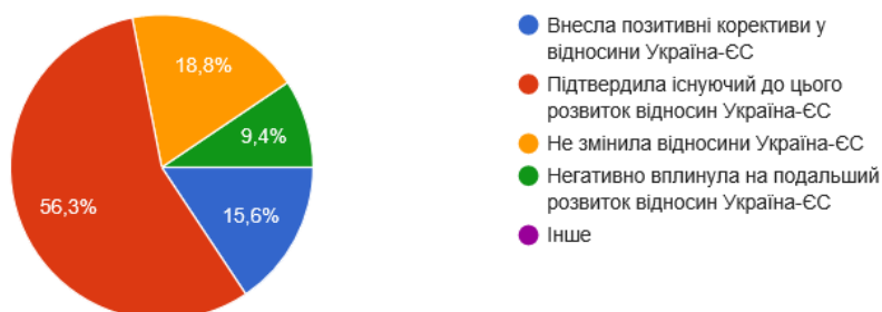
Рис. 4. Оцінка впливу схвалення Європейським Союзом Глобальної стратегії із зовнішньої і безпекової політики на відносини між Україною і ЄС