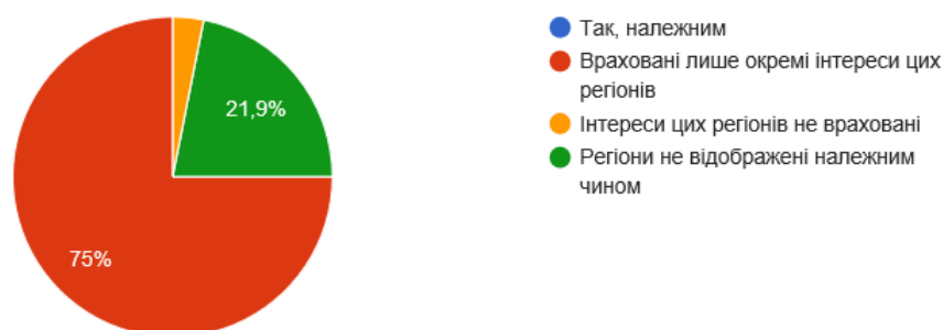
Рис.3. Відображення Східної Європи та Чорномор'я у Глобальній стратегії ЄС

Українські експерти відзначили недостатню увагу ЄС до України і регіонів Східної Європи та Чорномор'я. Як вважають 75% опитаних українських експертів, Стратегія враховує лише окремі інтереси цих регіонів (Рис.3). Чорномор'я, за оцінками Г.Шелест, опинилося поза увагою Глобальної стратегії, згадується у ній лише у контексті суверенітету й територіальної цілісності окремих країн і навіть не розглядається як регіон у цілому.