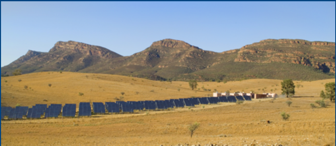
Eine Freiflächen-Photovoltaikanlage im Flinders Ranges Nationalpark zur Stromversorgung der Gegend Wilpena Pound.

Die Finanzierung des Klimaschutzes aus privaten Quellen nimmt bei den Klimaschutzbemühungen Australiens eine wichtiger werdende Rolle ein. Bei der Pariser Klimakonferenz 2015 sagte die australische Regierung ein finanzielles Engagement zur Bekämpfung des Klimawandels in Höhe von einer Milliarde australische Dollar (760 Millionen US-Dollar) über einen Zeitraum von fünf Jahren zu. Doch ohne klare Definitionen und zentrale Steuerung hat sich ein Flickenteppich an Initiativen in Australien entwickelt. Das Ergebnis ist eine wachsende, jedoch fragmentierte Klimafinanzierung des Privatsektors.