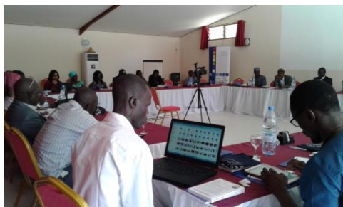
Des journalistes de toutes les parties du pays à l'atelier sur le sujet des médias numériques

Un accent particulier a été mis sur le rôle, les dangers et les opportunités des réseaux sociaux. Les journalistes ont été formés intensément sur les nouvelles opportunités. Le deuxième sujet était aussi important : la couverture médiatique du processus des élections présidentielles en début de l'an prochain. Les journalistes ont reçu aussi dans ce domaine, les informations et outils importants pour informer les populations de manière professionnelle, sur les candidats, le processus électoral, les résultats des élections et de prévenir ainsi des tensions sociales.