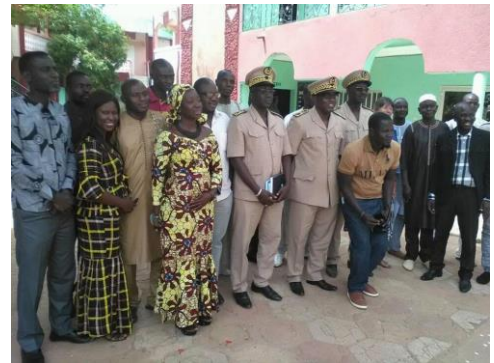
Le Gouverneur de la région de Kédougou a aussi participé à la formation

En année préélectorale, des tensions politiques ne sont pas rares au Sénégal, et souvent les causes de conflit se trouvent dans la gouvernance locale. C'est pourquoi la FKA au Sénégal et l'ADPBS ont organisé à Kédougou, une formation pour tous les maires et des conseillers communaux sélectionnés de toute la région.