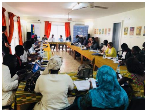
Plus de 50 participants ont discuté sur la situation économique actuelle au Sénégal.

Le jeudi 5 juillet 2018 nous avons organisé notre deuxième table ronde cette année, en coopération avec le think-tank ouest africain Wathi, dans les locaux du bureau de la FKA au Sénégal. Wathi est un think-tank ouest africain qui travaille surtout online et offre aux citoyens de tous les états d'Afrique de l'Ouest la possibilité de présenter et de discuter des publications sur des thèmes actuels de la politique ou de l'économie en Afrique de l'ouest. La deuxième table ronde a été consacrée au thème : « Développement économique et création d'emplois au Sénégal ».