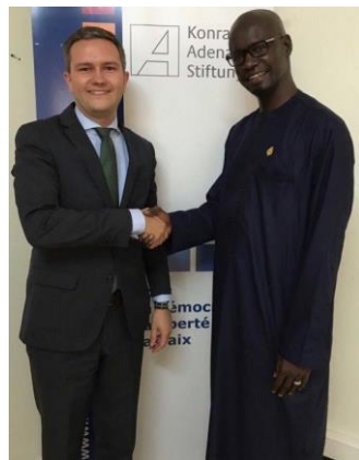
Député Bounama Sall en visite à la FKA

... Bounama Sall, membre de l'Assemblée Nationale du Sénégal, un jeune député, qui réfléchit sur la création d'emplois pour la jeune génération. L'échange s'est focalisé sur les thèmes comme la numérisation, la création d'emplois et des mesures pour la réduction des migrations irrégulières.