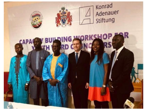
Le Ministre gambien de l'espace rural a ouvert l'atelier

Le bureau de la FKA avec siège à Dakar, a organisé, les 25 et 26 avril 2018, avec le Conseil National de la Jeunesse de la Gambie, un séminaire pour les conseillers communaux nouvellement élus, dans ce petit pays d'Afrique de l'Ouest. Plus de 40 jeunes conseillers communaux ont été formés dans le cadre de cet atelier de deux jours, dans les domaines des fondements de l'autogestion communale et édifiés sur leurs droits et devoirs en tant qu' élu communal. Le Ministre gambien de l'espace rural a ouvert l'atelier.