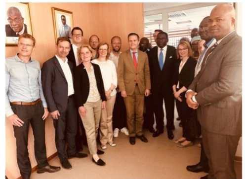
Le Ministre du Plan Sénégal Emergent PSE, Dr. Cheikh Kanté, a présenté les priorités du PSE.

février 2019. L'importance réside dans une intensification de l'engagement allemand au Sénégal surtout dans les secteurs suivants : Créations de places de formation et d'emploi et décentralisation.