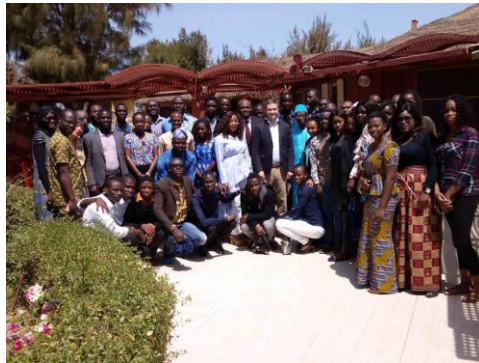
Les boursiers et anciens boursiers de la FKA lors de leur rencontre annuelle à St Louis

tuelle, la fondation se réjouit d'avoir promu la formation de plus de 180 boursiers de différents pays d'Afrique de l'ouest. La rencontre de cette année a été consacrée aux questions de l'intégration africaine et des institutions régionales et continentales comme la CEDEAO et l'Union Africaine (UA). La rencontre annuelle est aussi une occasion de lier davantage les anciens boursiers au travail de la fondation.