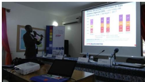
Présentation des résultats de l'enquête de Afrobaromètre

organisé la première manifestation commune avec Afrobaromètre. Au cours de la manifestation qui a vu la participation de représentants de ministères, des journalistes, des scientifiques et des représentants de la société civile, furent présentés les résultats de la nouvelle étude des chercheurs associés sur le thème : « Politiques publiques et priorités des citoyens au Sénégal ».