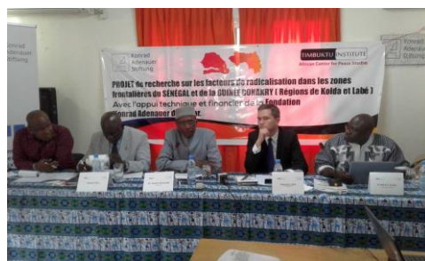
L'ambassadeur Seydou Nourou Ba a ouvert le séminaire.

La FKA au Sénégal et le Timbuktu Institute, une institution de recherche sur la paix en Afrique, ont présenté leur projet de recherche sur la radicalisation dans la région frontalière entre Kolda au Sénégal et Labé en Guinée, en présence de nombreux représentants des universités, du monde politique et de la société civile. On a salué également la présence du Colonel Adje et de l'Ambassadeur Seydou Nourou Ba qui a procédé à l'ouverture de la manifestation. Les collaborateurs de Timbuktu Institute ont expliqué le contexte, les objectifs et le chronogramme de l'étude avant d'explicitier les méthodes de recherche et d'évaluation statistique de l'étude qui sera publiée dans le courant du dernier trimestre de l'année.