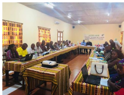
Formation pour multiplicateurs en année préélectorale sur le système politique

Le 24 février 2019 est la date des élections présidentielles au Sénégal – dans la même année auront lieu aussi les élections communales. Afin de sensibiliser la population à temps sur les échéances électorales à venir, des séminaires sont organisés déjà cette année, sur toute l'étendue du territoire, sur le thème du système politique du Sénégal et les droits et devoirs des citoyens.