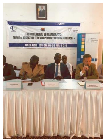
Le Gouverneur de la région de Kaolack a également participé à la conférence.

Les 8 et 9 mai 2018 a eu lieu à Kaolack, une ville carrefour au centre du Sénégal, en coopération avec TAATAAN-ASADIC, une conférence sur le thème « Développement économique local pour la réduction des causes de migration ». Ce fut dans le même temps, la manifestation de lancement d'une série que le bureau de la FKA au Sénégal organise en 2018 avec TAATAAN-Asadic.