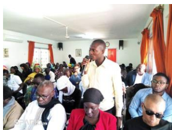
Après le lancement a eu lieu une discussion animée sur les migrations

Plus de 100 acteurs intéressés des médias, de la société civile et de la politique ont participé le 16 avril à la présentation de la nouvelle publication de la FKA au Sénégal en coopération avec le CESTI. Le livre a pour titre : « Migrations. Problèmes, itinéraires et défis pour le Sénégal » et a été présenté par le rédacteur en chef, le lancement a été suivi de discussions. Un accent particulier a été mis sur les possibilités des migrations interafricaines et les opportunités d'emploi au sein de la zone monétaire ouest africaine, sans oublier des conseils concernant la fondation d'entreprise dans les pays voisins africains et les chances d'une amélioration des opportunités d'échanges commerciaux.