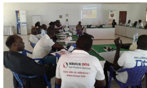
Formation de jeunes journalistes sur la manière de relayer les thèmes afférents au terrorisme et à la radicalisation

En coopération avec le Timbuktu-Institute, la FKA du Sénégal a organisé le 2 mai 2018 à Mbour, un séminaire pour journalistes avec le but d'une clarification de la responsabilité des journalistes dans le traitement des thèmes comme l'extrémisme et le terrorisme. C'était la première formation des jeunes journalistes sur cette thématique.