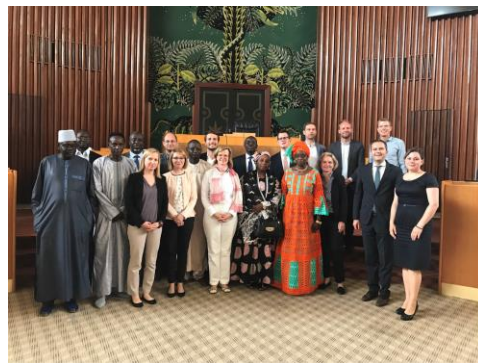
Les membres de la délégation allemande avec des députés de L'Assemblée Nationale.

Dans le cadre de l'atelier, les participants ont pu échanger avec des représentants du Gouvernement du Sénégal, des députés, des journalistes et des acteurs de la société civile.