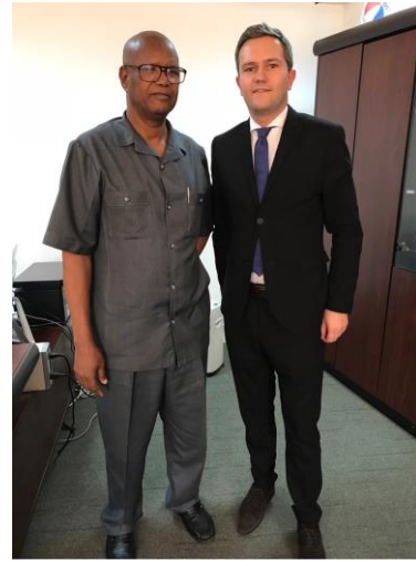
Le ministre de l'Information de la Gambie, remercié le 1 er juillet 2018

... le Ministre de l'Information de Gambie. L'entretien a eu lieu en avril 2018. L'ancien journaliste a été remercié de manière inattendue, le 1 er juillet 2018, dans le cadre d'un remaniement du Gouvernement du chef de l'Etat Adama Barrow. On a reproché au ministre de n'avoir pas suffisamment communiqué sur les réformes du Gouvernement depuis janvier 2017.