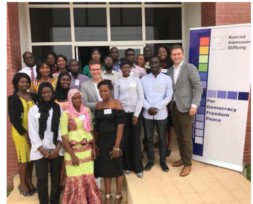
Jungunternehmer in Gambia: motiviert und engagiert.