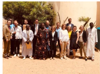
Visite du village côtier Thiaroye, d'où beaucoup de jeunes Sénégalais ont commencé l'émigration clandestine.

Dans le cadre de l'atelier des experts allemands sur place au Sénégal on a clarifié que les attentes et les réalités d'un partenariat de migrations avec le Sénégal sont fort divergentes. Il est important de procéder à un travail de sensibilisation.