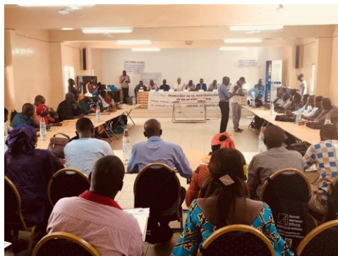
Grand intérêt lors du séminaire sur la création d'emplois à Vélingara

Le 15 mai fut organisé à Vélingara en Casamance, en coopération avec le partenaire de coopération de longue date le CASADES, un forum sur le thème : « Création d'emplois et perspectives pour la population jeune ». Les participants ont discuté sur les possibilités de créations d'emplois dans cette ville structurellement faible et fortement frappée par la migration irrégulière.