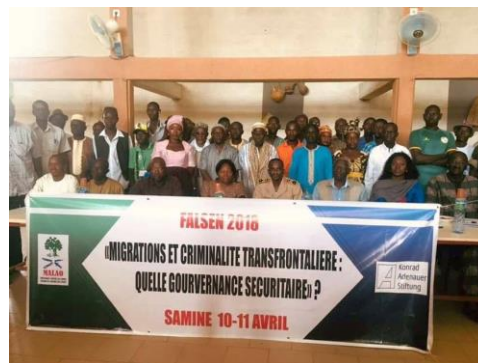
Participants du séminaire sur les migrations à Samine.

frontières dans la région serait insuffisant et la libre circulation une réalité pratique.