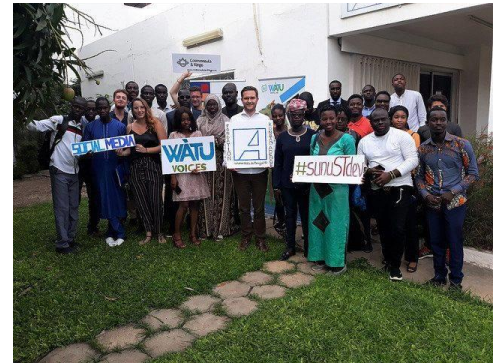
Première manifestation de la FKA Sénégal avec Watu Digital Lab.

Ainsi on a compris que la scène des blogueurs est très active au Sénégal et que les „fake news“ dominent de plus en plus aussi le marché des informations sénégalais.