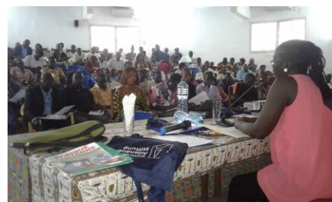
Forum de la jeunesse avec le CNJS Ziguinchor.

février à Dakar, ont eu lieu des fora régionaux de la jeunesse à St Louis au Nord, à Ziguinchor au Sud, à Tambacounda et à Kédougou. A chaque forum on a constaté un grand engagement de la jeunesse qui veut participer au développement du pays. Ils souhaitent davantage de possibilités de s'impliquer afin de ne plus être obligés de quitter la patrie et la famille.