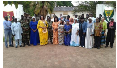
Avec des députés de l'Assemblée Nationale à Ziguinchor au Sud du Sénégal

En juillet 2017, le Sénégal élu une nouvelle Assemblée Nationale. Comme le parlement a été enrichi de 15 députés de la diaspora, il a actuellement 165 députés. Dans le but de soutenir les députés dans leur travail parlementaire, la Fondation Konrad Adenauer organise depuis 2018, de nombreuses manifestations avec le parlement. Du 1er au 4 juillet, on a organisé à Ziguinchor, au Sud du Sénégal, une première manifestation sur place avec 26 députés, sur le thème « La sécurité en zone frontalière au Sénégal ». En août suivra une manifestation sur-place sur la thématique des migrations.