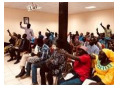
Les conseillers communaux nouvellement élus ont participé avec engagement au séminaire

Le 18 avril 2018 ont eu lieu les élections communales en Gambie. Depuis les élections présidentielles en décembre 2016, le pays se trouve dans un processus profond de transformation. Le pays parcourt de nombreuses réformes de politique intérieure depuis l'élection démocratique du président Adama Barrow en janvier 2017, après plus de deux décennies de régime autoritaire du président Yaya Jammeh. Les élections communales d'avril 2018 étaient les premières élections au niveau local depuis le changement de régime.