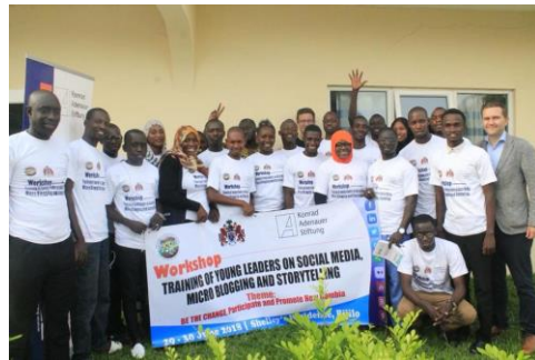
Formation de jeunes femmes et hommes politiques dans le domaine des médias sociaux

Les 29 et 30 juin on a organisé un autre atelier avec Juri Schnöller – cette fois-ci avec le National Youth Council of The Gambia. L'atelier fut intitulé : „The political power of social media and fake news“ et a eu un input actuel en Gambie, où circulent, dans les réseaux sociaux, de nombreuses supputations concernant le remaniement gouvernemental actuel. De jeunes hommes et femmes politiques ont reçu un renforcement des capacités et des conseils concrets en vue d'une utilisation des médias sociaux dans leur travail politique en Gambie.