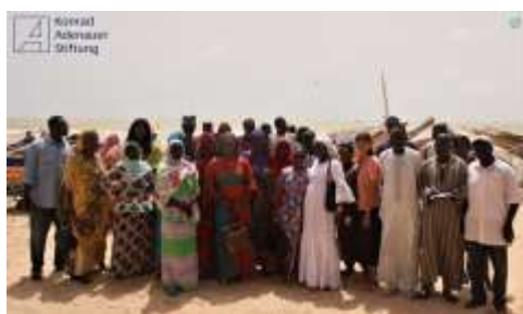
Des députés de l'Assemblée Nationale Abgeordnete ont organisé avec la FKA un séminaire à St Louis

En 2018 l'Assemblée Nationale et la Fondation Konrad Adenauer ont coopéré dans le cadre de deux manifestations „sur place avec des députés, à Ziguinchor en Casamance sur le sujet de la sécurité en zone frontalière, et à St Louis au Nord du pays sur la thématique des migrations.