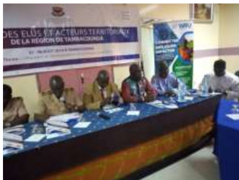
La conférence avec TAATAAN-Adadic à Tambacounda. Le Gouverneur fut aussi présent.