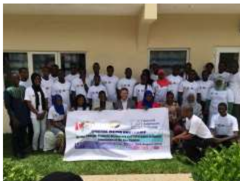
Atelier en communication politique dans les réseaux sociaux avec des jeunes acteurs politiques en Gambie

Ensemble avec le Conseil National de la Jeunesse de Gambie, la FKA a initié une formation sur les réseaux sociaux à l'intention des organisations de jeunes des partis politiques et des jeunes multiplicateurs. Les jeunes acteurs politiques apprennent, après plus de deux décennies de règne autocratique, ce que c'est la liberté d'opinion et de médias, qui vont d'ailleurs de pair, dans les réseaux sociaux, avec des „faked news“ et des faits alternatifs. Les participants ont discuté en détail de ces sujets et d'autres questions dans le domaine de la formation d'opinion.