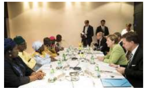
La chancelière Merkel en entretien avec des représentants de la société civile à Dakar, parmi eux trois partenaires de la FKA.

La chancelière fédérale Dr. Angela Merkel a visité entre le 29 et le 31 août 2018 le Sénégal, le Ghana et le Nigéria, accompagnée d'une délégation d'acteurs économiques allemands. Les sujets de la promotion de l'économie et des migrations ont été un focus de son voyage officiel. La visite de la chancelière du 29 et 30 août est la première visite d'un chef de gouvernement allemand au Sénégal.