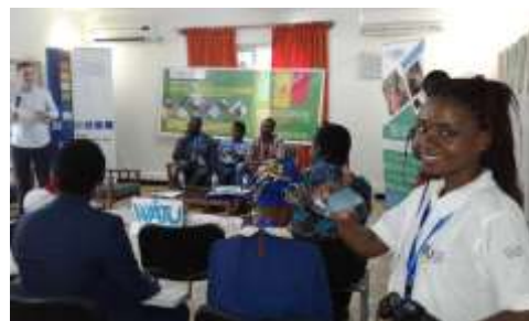
Conférence pour start-ups au Sénégal. On a mis l'accent sur les défis et les opportunités

En juillet a eu lieu, en coopération avec le jeune start-up Watu Digital Lab, une conférence d'un jour pour des start-ups au Sénégal. Au centre de la conférence: un état des lieux des start-ups qui sont actuellement actifs au Sénégal et de leurs spécialités. Dans une seconde phase, il s'est agi de créer des effets de synergie et de discuter sur les défis communs des start-ups dans ce pays d'Afrique de l'Ouest.