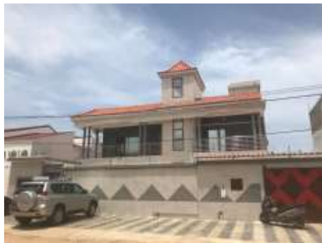
Le nouveau bureau de la Fondation Konrad Adenauer à Dakar Almadies

Fondation Konrad Adenauer au Sénégal Dakar-Almadies / Zone 9 En face Groupe scolaire „La Pointe des Almadies“ Dakar - Sénégal