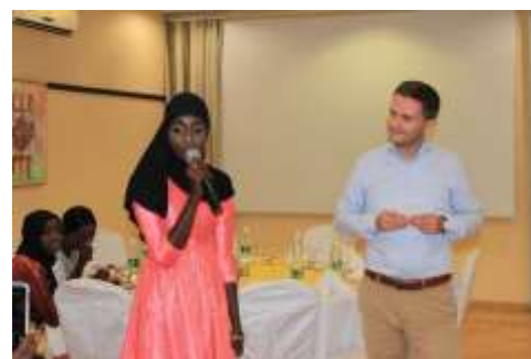
Des jeunes entrepreneurs de Gambie présentent leurs idées de start up et de fondation d'entreprise

La Fondation Konrad Adenauer est, depuis le 1 er février 2018, la première fondation politique représentée en Gambie. Parmi les partenaires actuels nous comptons la Chambre gambienne de commerce et d'Industrie (GCCCI) et le Conseil National de la Jeunesse de la Gambie. Plusieurs ateliers et séminaires ont été organisés avec les deux organisations.