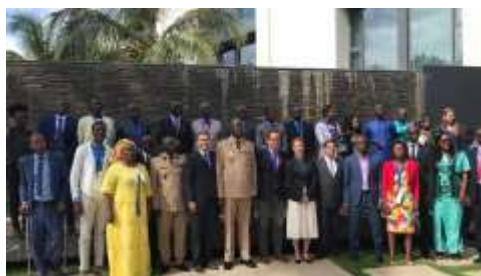
Membres des Forces Armées, journalistes et experts sécuritaires ont échangé sur l'extrémisme en Afrique de l'Ouest.

Le 6 septembre a eu lieu, à Dakar, une conférence organisée ensemble avec le programme régional « Dialogue de politique de sécurité en Afrique subsaharienne (SIPODI), pour discuter sur des mécanismes de prévention de la radicalisation et de l'extrémisme islamique en Afrique de l'Ouest. Les participants à cette conférence d'un jour étaient des experts en sécurité, des membres des Forces Armées, des journalistes et des représentants de la société civile.