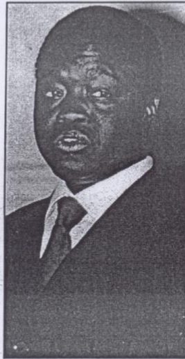
Ministre de l'Alphabétisation, des Langues nationales et de la Francophonie, Diégane Sène estime que la formation des journalistes s'avère nécessaire pour qu'ils jouent leur rôle dans la gestion des conflits.

Tour à tour les conférenciers ont donné des études de cas. Notamment au Rwanda, où la radiotélévision des mille collines a été le précurseur du conflit de 1994, en Côte d'Ivoire avec les médias partisans et enfin dans le conflit sénégal-mauritanien de 1989 où des médias ont amplifié les faits et aggravé le conflit. C'est pourquoi, dira le ministre de