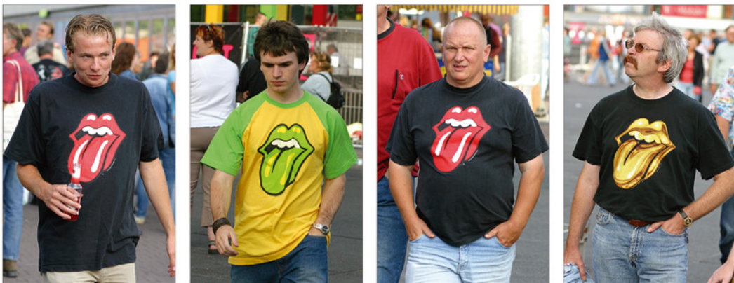
Photo Note August 19, 2003 Amsterdam Arena Boulevard 18.15 - 19.00