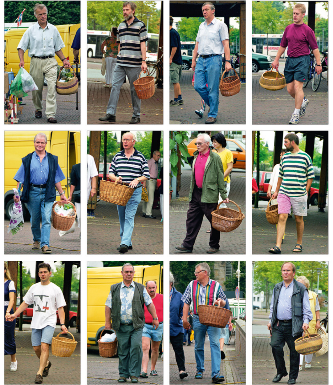
Photo Note August 7, 1999 Nordhorn Market 11.10 - 11.30