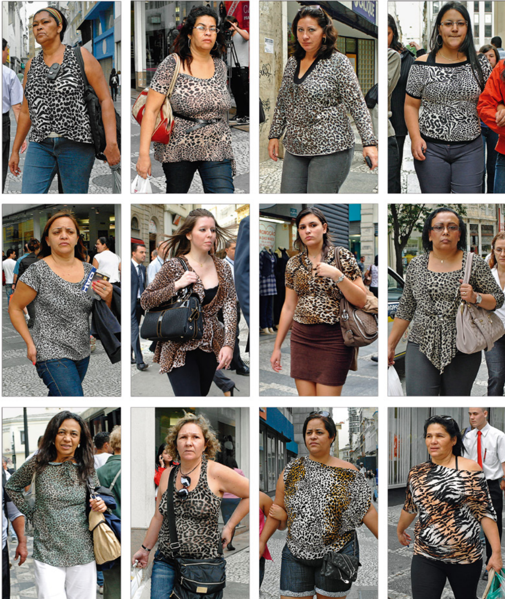
Photo Note May 10, 2012 São Paulo Rua Direita 12.00 - 15.00