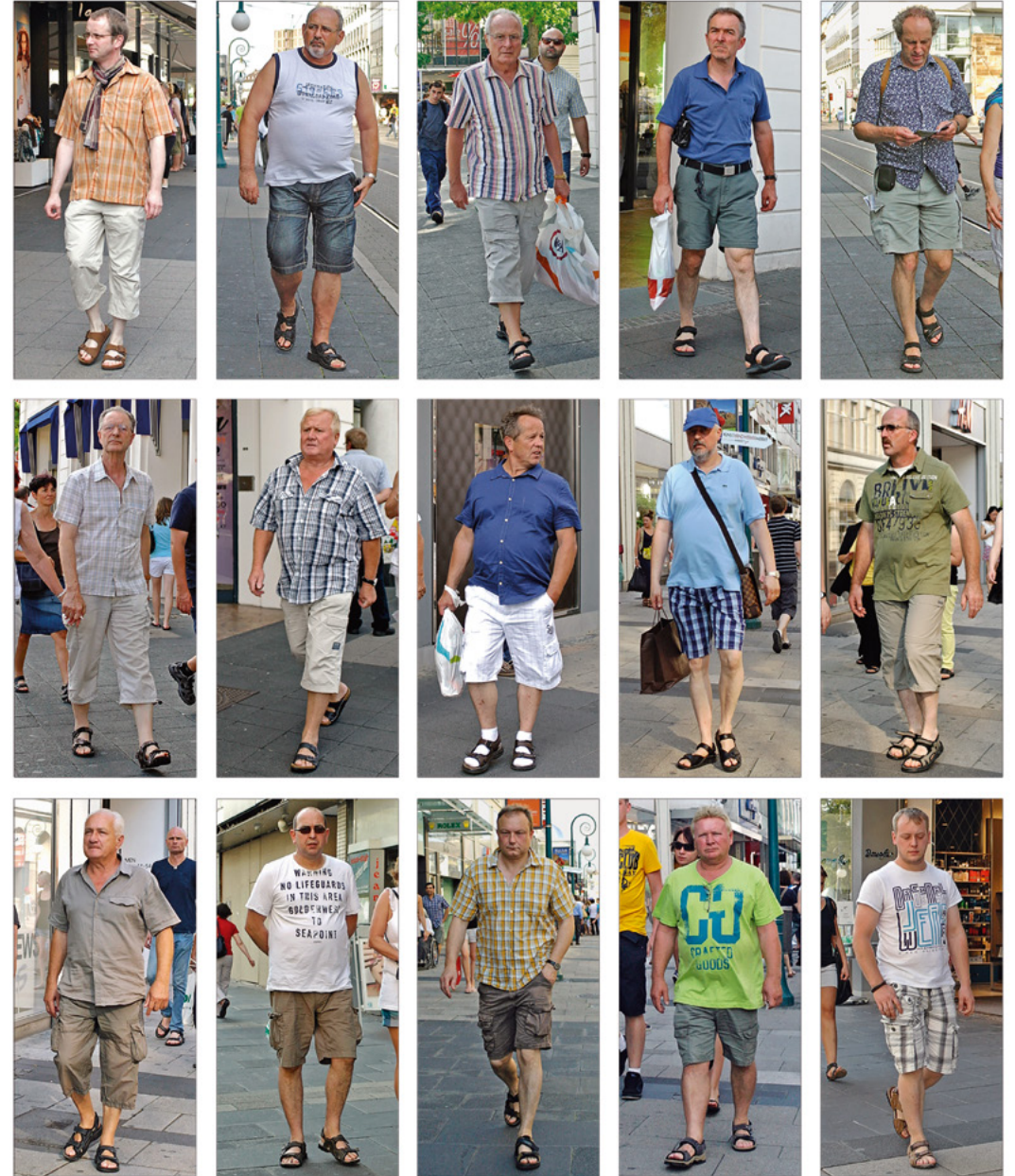
Photo Note July 27, 2012 Kassel Konigs Strasse 17.15- 18.15