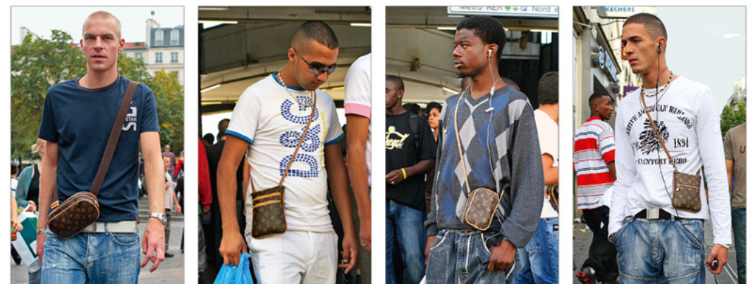
Photo Note September 9, 2006 Paris Rue Pierre Lescot 11.20 - 12.45