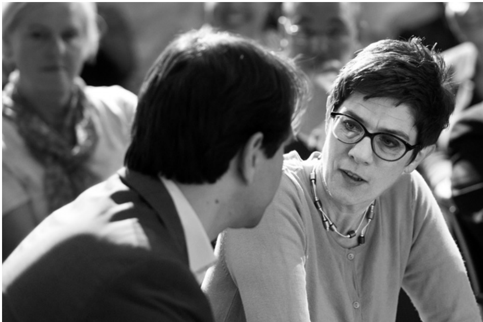
Annegret Kramp-Karrenbauer auf ihrer Zuhör-Tour in Konstanz.

Spiegelt die Zuhör-Tour eine revitalisierte Haltung wider, die Sie Ihrer Partei allgemein anempfehlen möchten und die darin besteht, verstärkt auf einfache Menschen zuzugehen? Helmut Kohl hätte hinzugefügt: „draußen im Lande“.