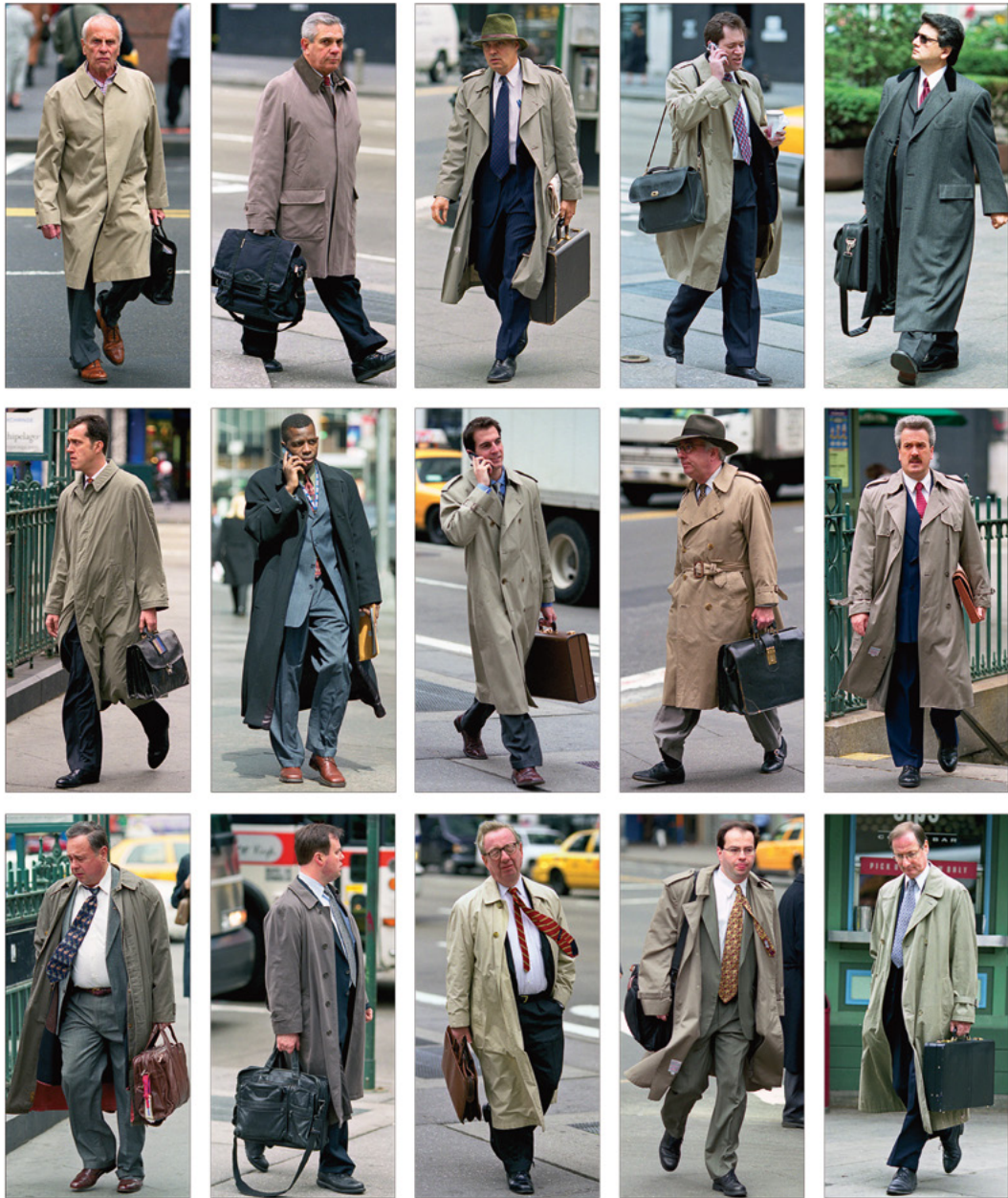
Photo Note April 8, 2002 New York 6th Avenue # 42nd Street 11.00 - 12.00