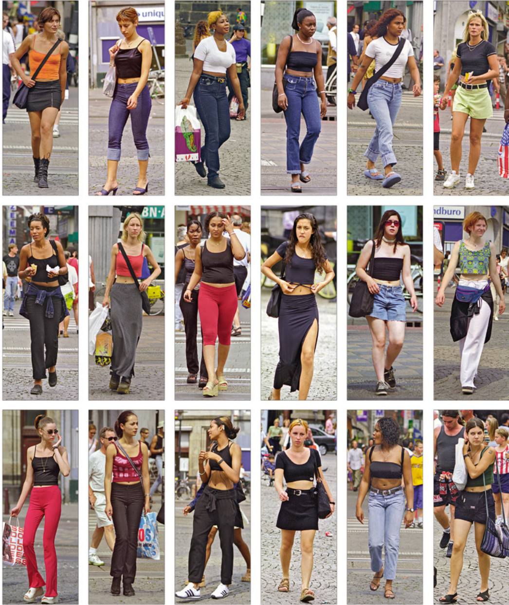
Photo Note August 3, 1999 Amsterdam Dam 15.30 - 16.15